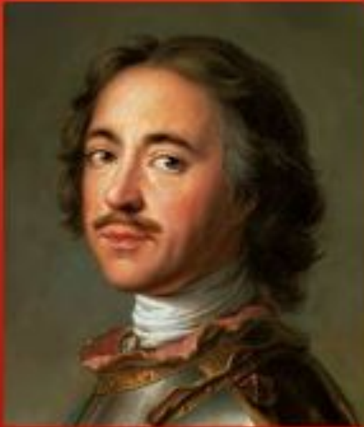
Портрет Петра I, 1717г

Создал новую городскую среду с неизвестными прежде формами быта и времяпрепровождения (театр, маскарады). С 1718 были введены ассамблеи, где дворяне танцевали и свободно общались, в отличие от прежних застолий и пиров.