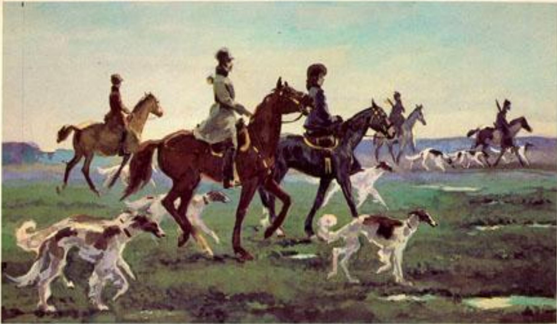
Эпизод охоты (2 том, 4 часть, 3-7 главы)