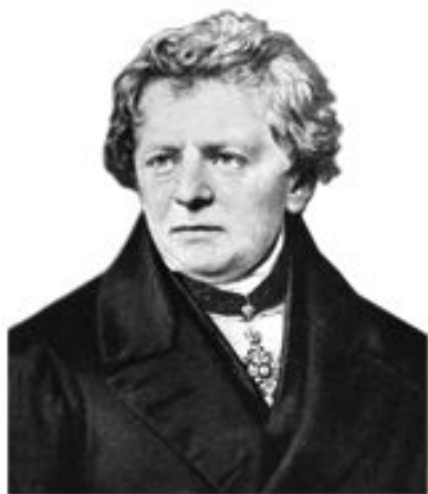
Ом Георг Симон (1787-1854)

Его имя носит знаменитый закон электротехники и единица измерения электрического сопротивления