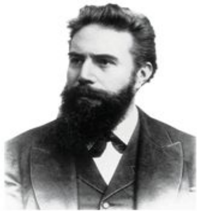
Вильгельм Конрад Рентген (1845-1923)

«Икс-лучи принадлежат всем, всему человечеству...»