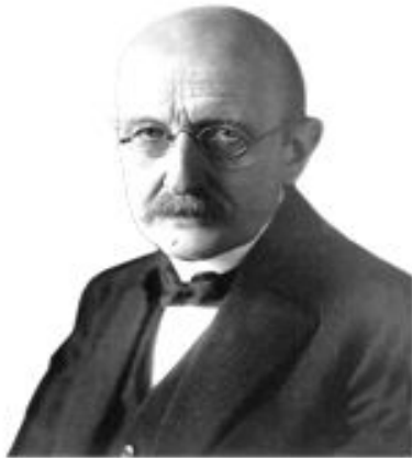
Макс Планк (1858 - 1947)

Основоположник квантовой теории, Вывел закон излучения, названный его именем.