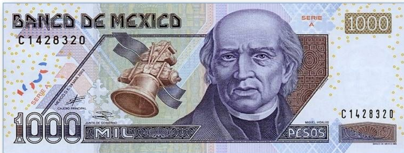
Мигель Идальго на мексиканской купюре 1000 песо

Освободительное движение в Мексике началось с крестьянского восстания под предводительством сельского священника Мигеля Идальго .