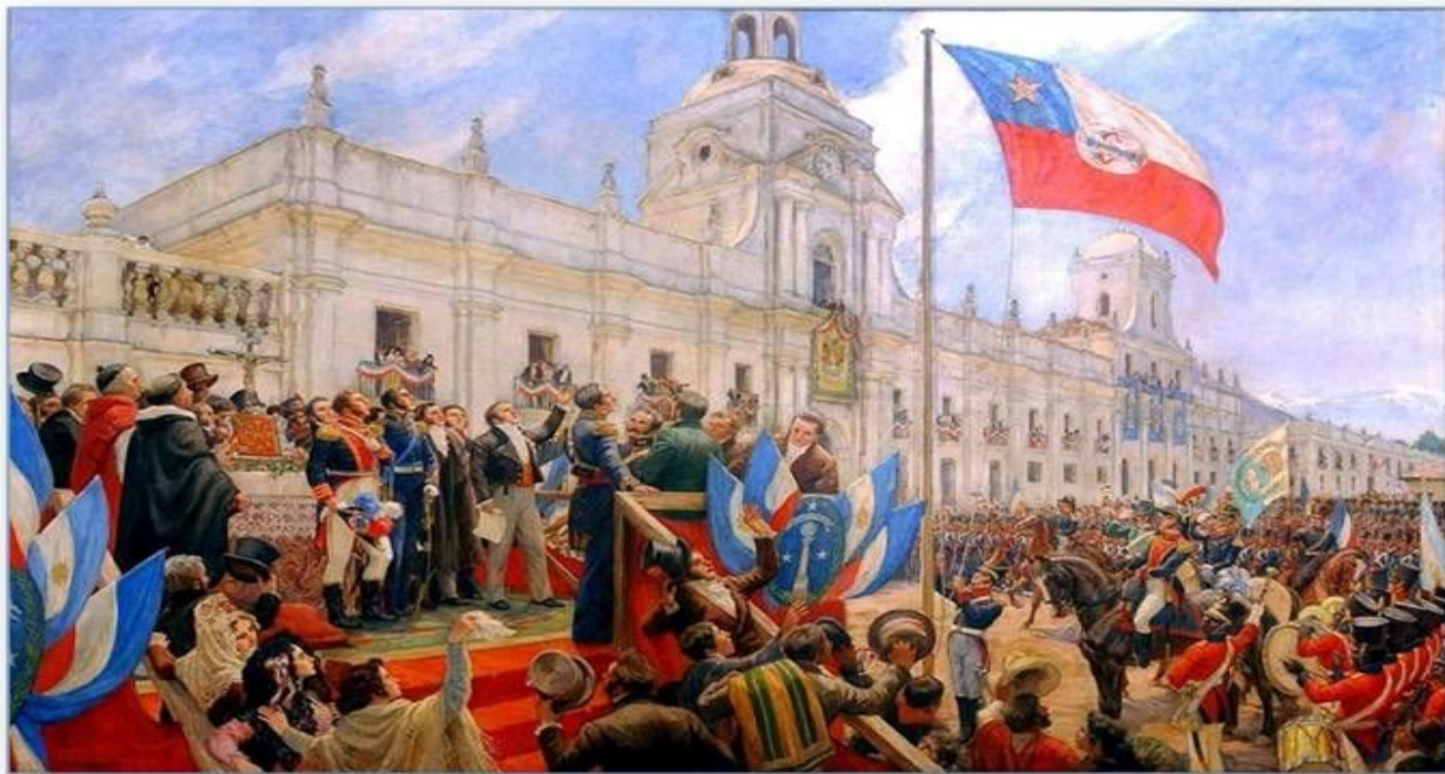
Война за независимость испанских колоний

Серьезные поражения Испании от наполеоновской Франции в 1809—1810 гг. послужили сигналом к началу освободительных восстаний. Война за независимость испанских колоний длилась с 1810 по 1826 г.