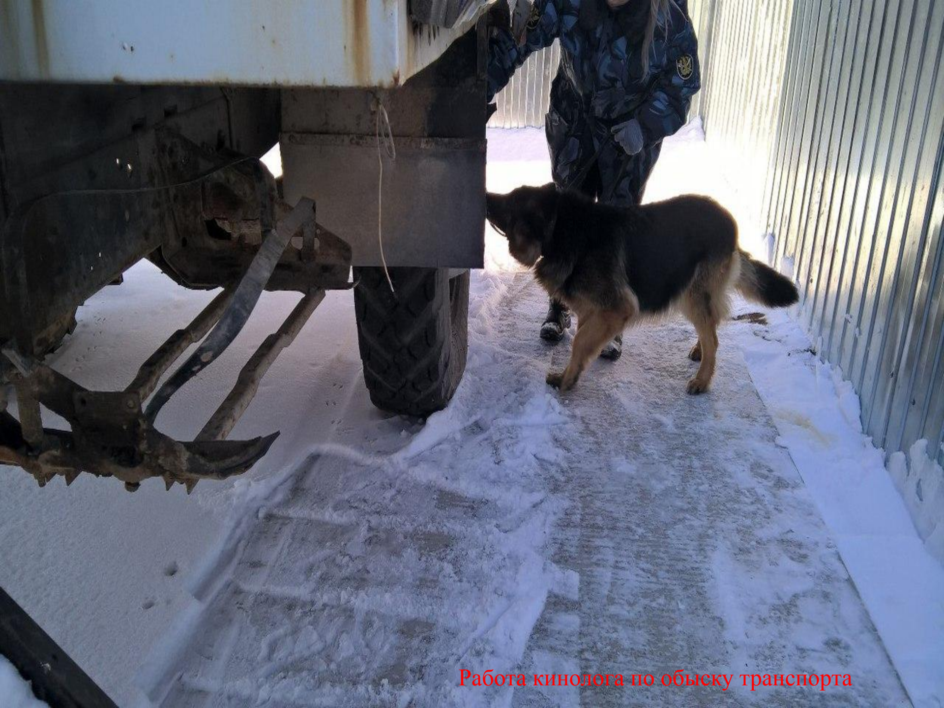
Работа кинолога по обыску транспорта