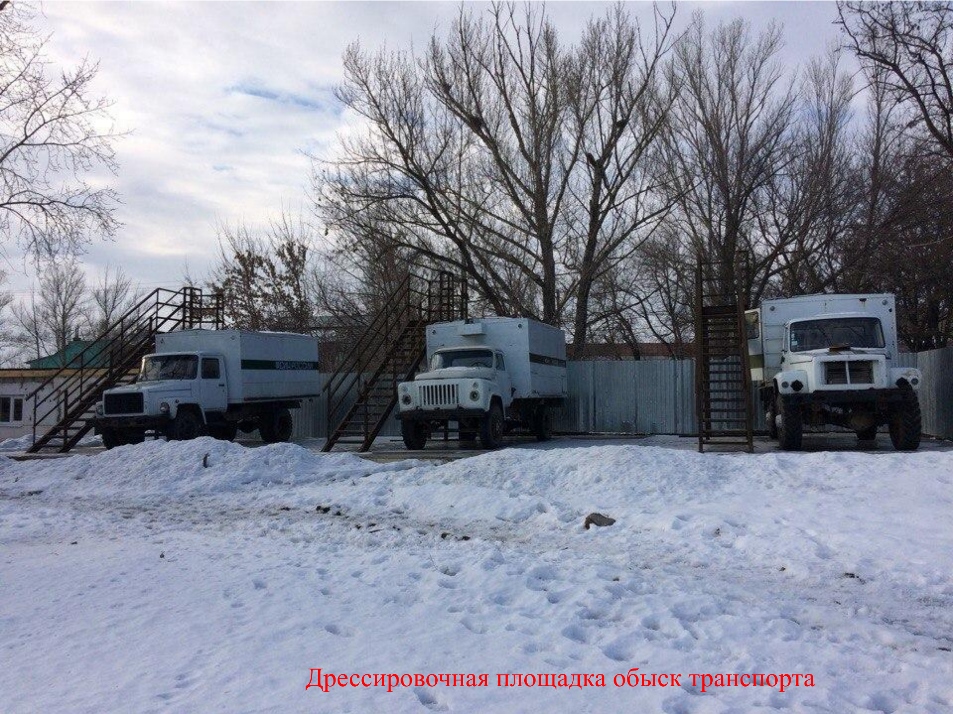
Дрессировочная площадка обьск транспорта