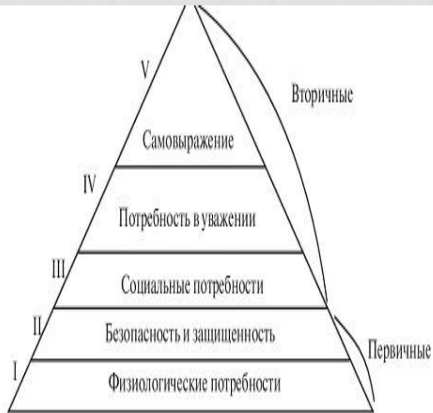
Рис. 2.2. Пирамида потребностей А. Маслоу