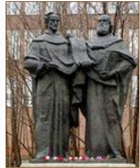
Памятники основателям славянской письменности Кириллу и Мефодию