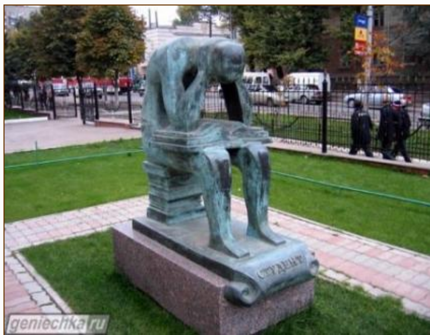
Саратов. Памятник студенту.