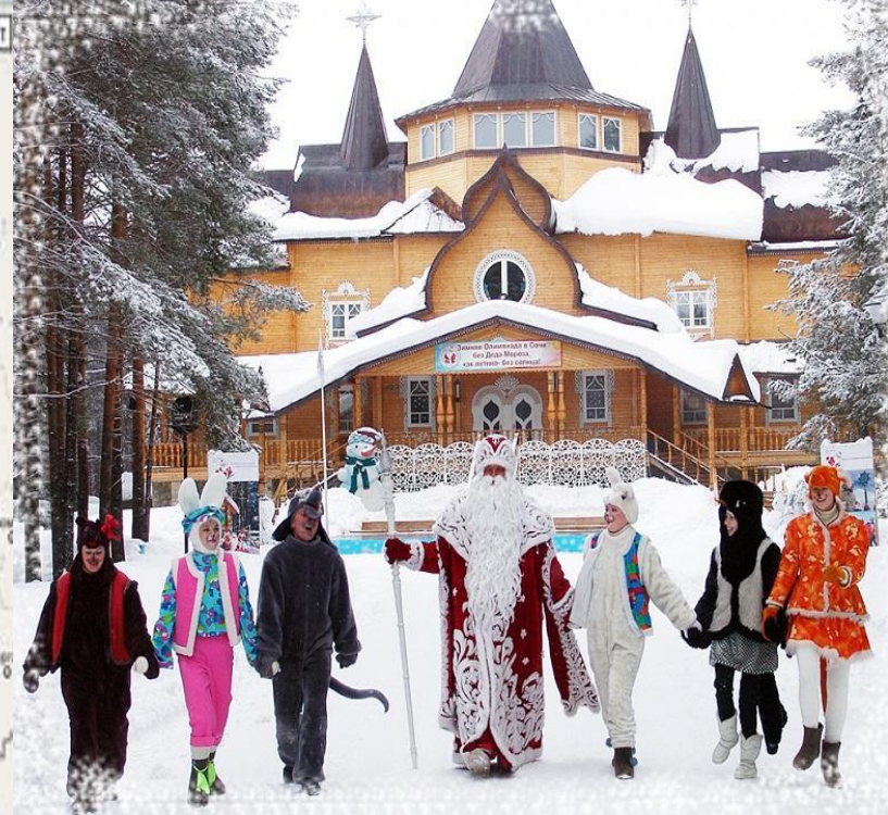
Резиденция Деда мороза. Город Великий Устюг. Вологодская область.

Великий Устюг — один из древних русских городов Вологодской области — один из древних русских городов Вологодской области, располагается в 450 км к северо-востоку от Вологды