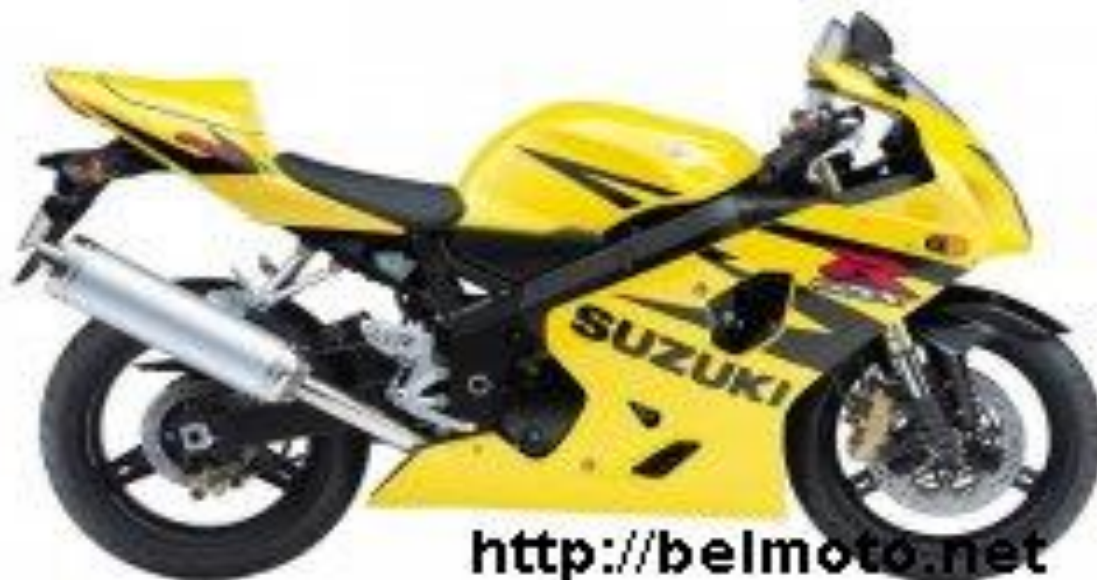
Suzuki GSX-R 600 2004