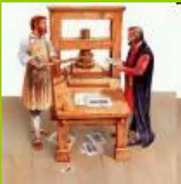
Печатный станок Иогана Гутенберга

Печатная книга – источник наших знаний появилась с средние века.