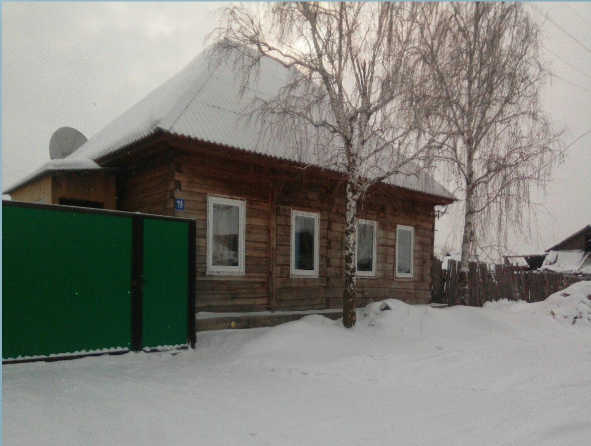
Дом, где жил будущий офицер.

«А дома, в Росси... У милой крылечко грустит в тишине...»