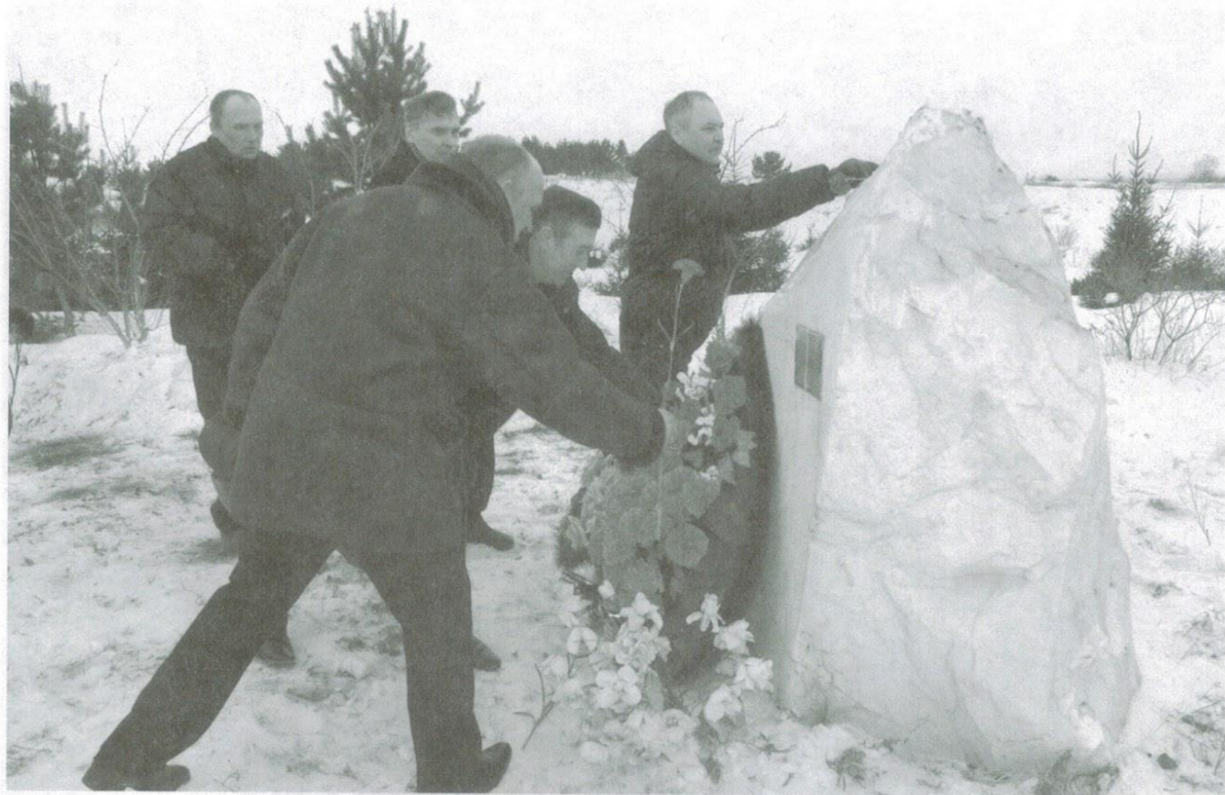
У Памятного камня. г. Минусинск, 15 февраля 2013 г.