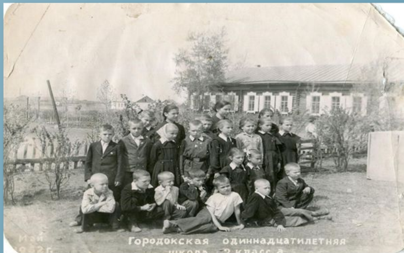
Городокская одиннадцатилетняя школа – 2 класс а