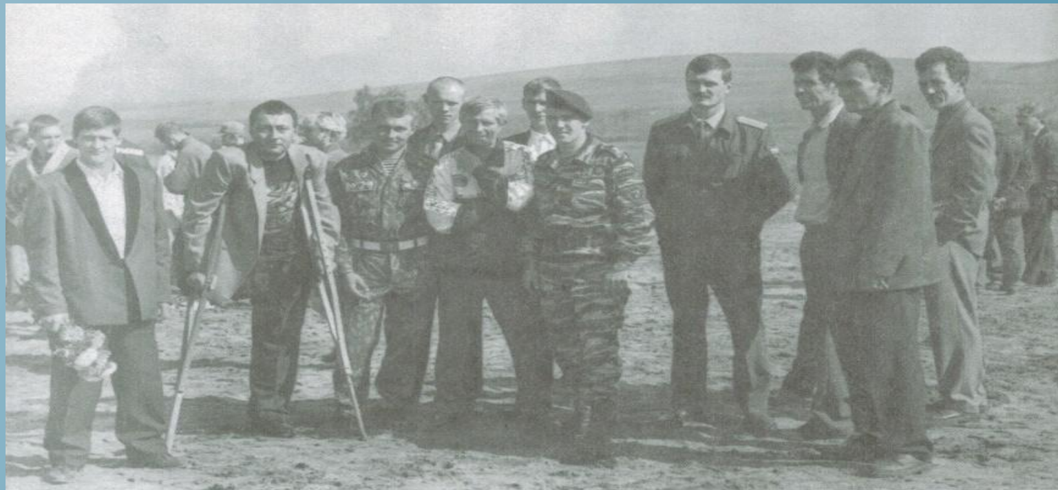
Закладка памятного камня воинам-интернационалистам. 3 сентября 1999 г. МКМ ОФ 9352/64.