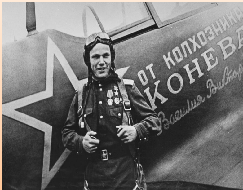
Иван Никитович Кожедуб у истребителя Ла-5ФН

Для постройки истребителя требовалось внести 100 тыс. рублей - сумму немалую для простого колхозника. Тем более, что деньги в годы военного лихолетья лишними не были. Но таков был настрой большинства граждан Советского Союза - отдать все для победы. Накоплений Виктора Васильевича немного не хватало, и он продал все, что мог, но самолет купил.