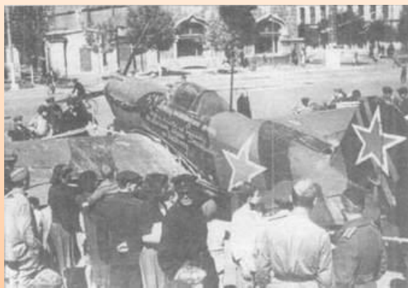
Именной Як-1 Ферапонта Головатого, выставленный на площади в г. Саратове ноябрь 1942 г.