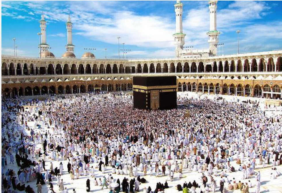
Мекке, Сауд Арабиясы