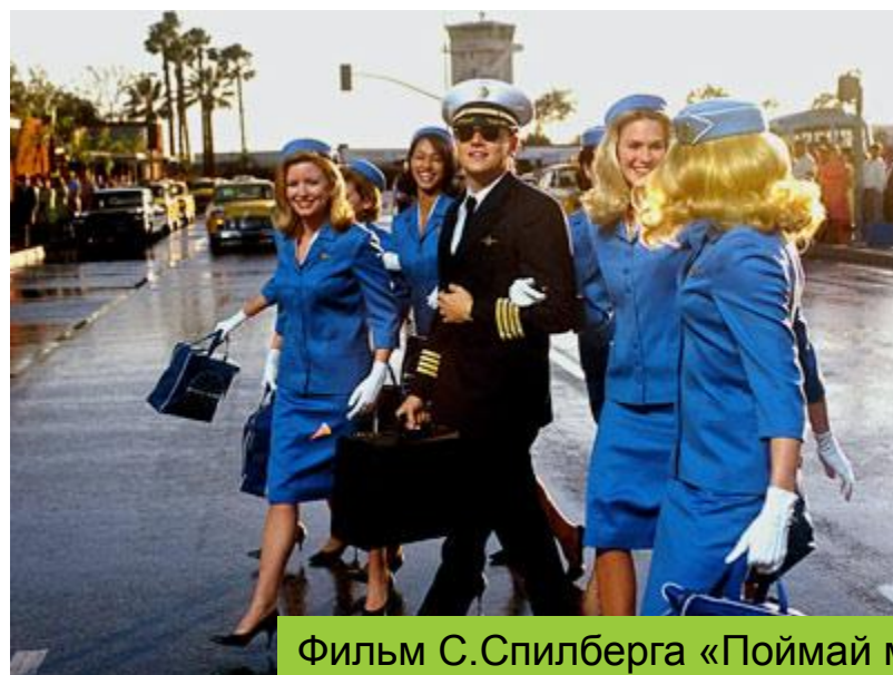
Фильм С.Спилберга «Поймай меня, если сможешь»