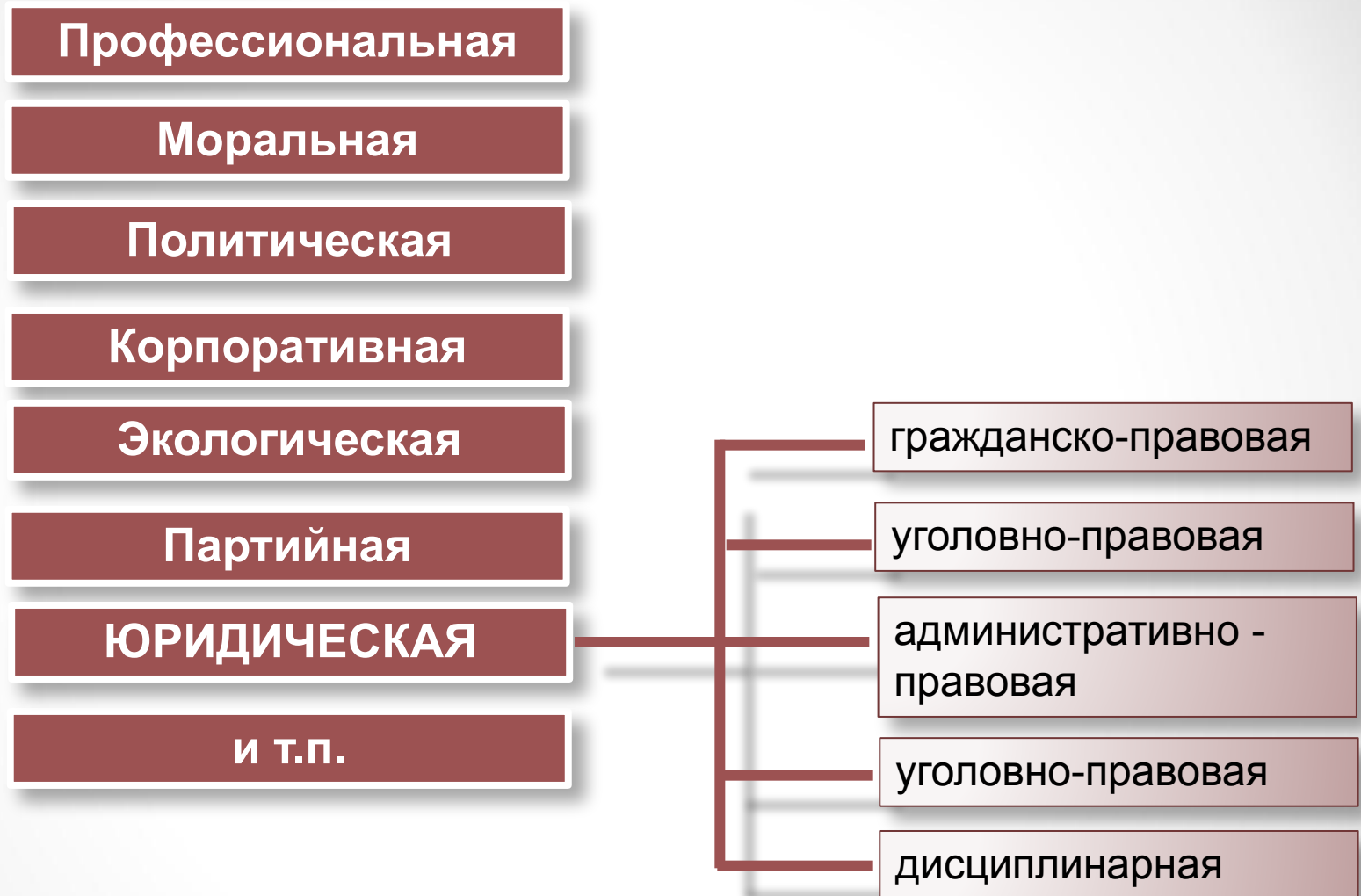
Рис. 7 Виды социальной ответственности