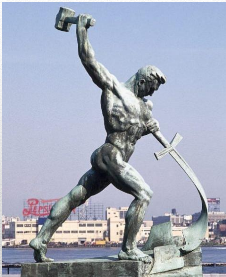
«Перекуём мечи на орала» 1957 год.

Вучетич становится автором аллегорической статуи «Перекуём мечи на орала», установленной у здания ООН в Нью-Йорке (США). Её копия сейчас находится недалеко от филиала ГТГ на Крымском валу в Москве.