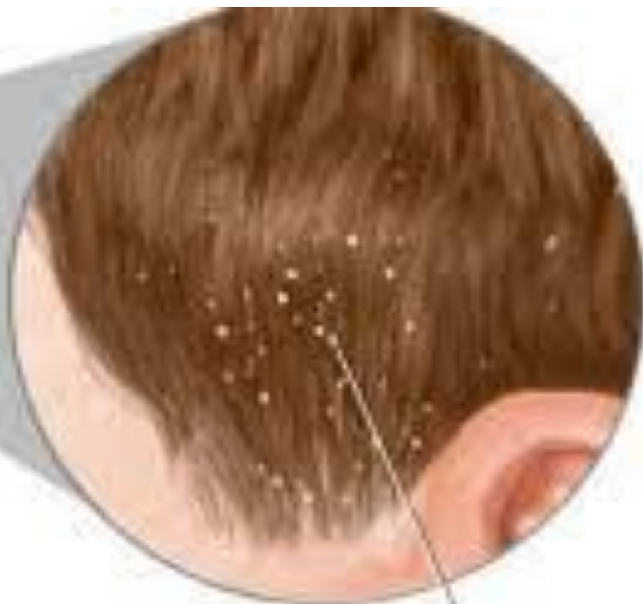
Гниды головных вшей, прикрепленные к волосам