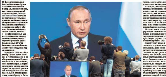
Владимир Путин в разговоре с журналистами

20 февраля президент России Владимир Путин выступил с посланием Федеральному собранию, в котором объявил о намерении посетить США и встретиться с президентом Дональдом Трампом. Путин также объявил о намерении посетить США и встретиться с президентом Дональдом Трампом.