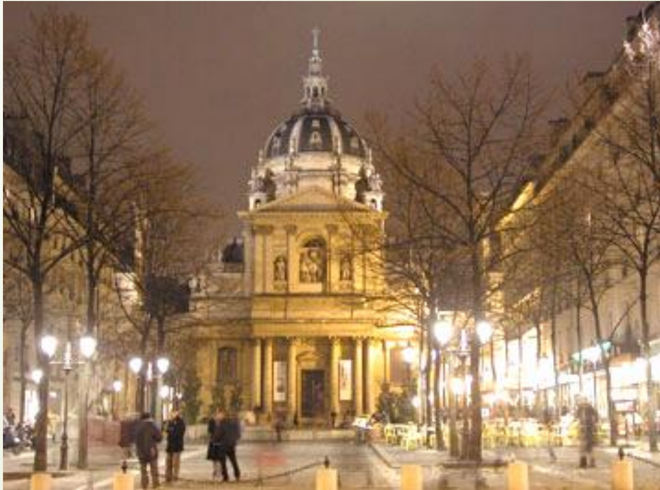
«Купол знаний» в Парижском университете (Сорбонна)