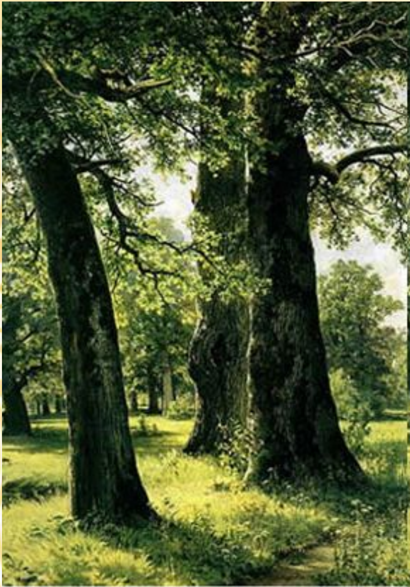
Дуби. 1887р. Державний Російський музей, Москва.