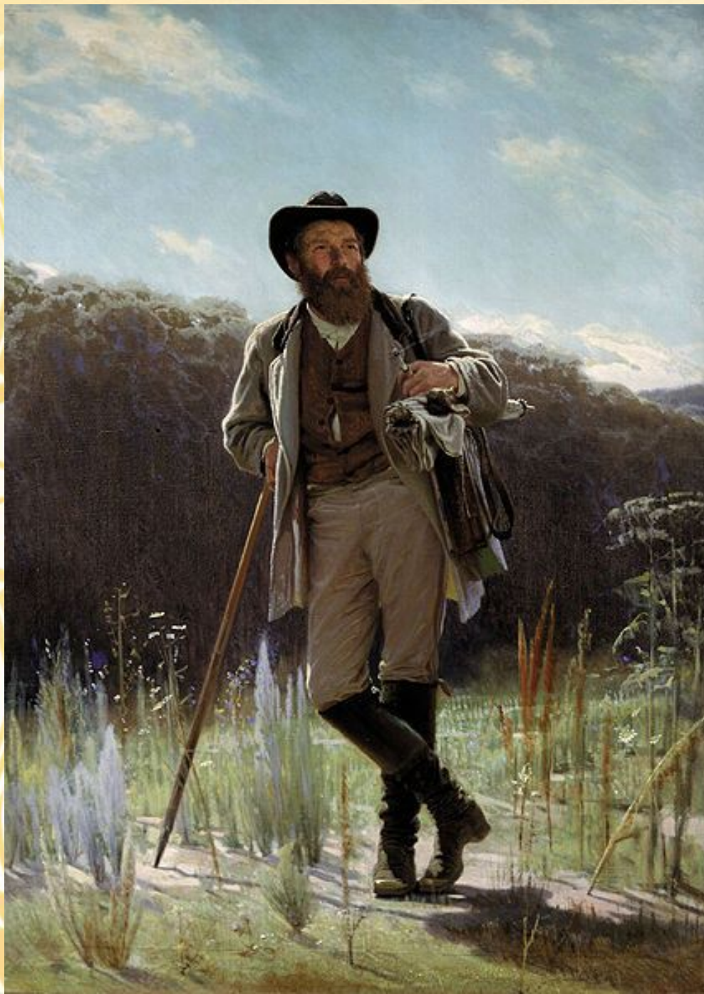
Портрет І. Шишкіна роботи І.М. Крамського