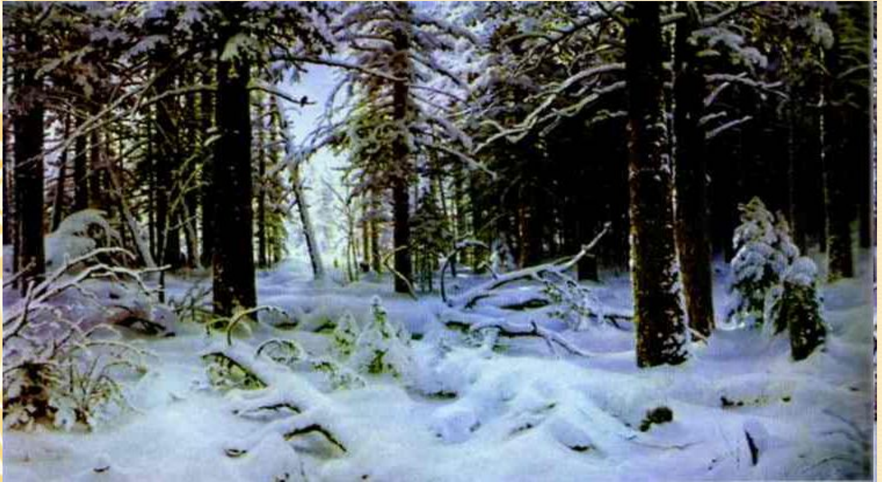
“Ранок в сосновому бору”

Ще на початку творчого шляху Іван Шишкін записав у свій альбом, що "найголовнішим для пейзажиста є старанне вивчення натури" . Він ніколи не змінював цьому принципу.