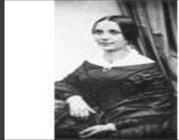
Мать - Франциска Ницше (Элер)

Фридрих Вильгельм Ницше, первый сын священника, лютеранского пастора Карла Людвига Ницше и Франциски Ницше, родился 15 октября 1844 года. Ницше рос в глубоко верующей семье, и вера составляла основу его мироощущения в детские годы.