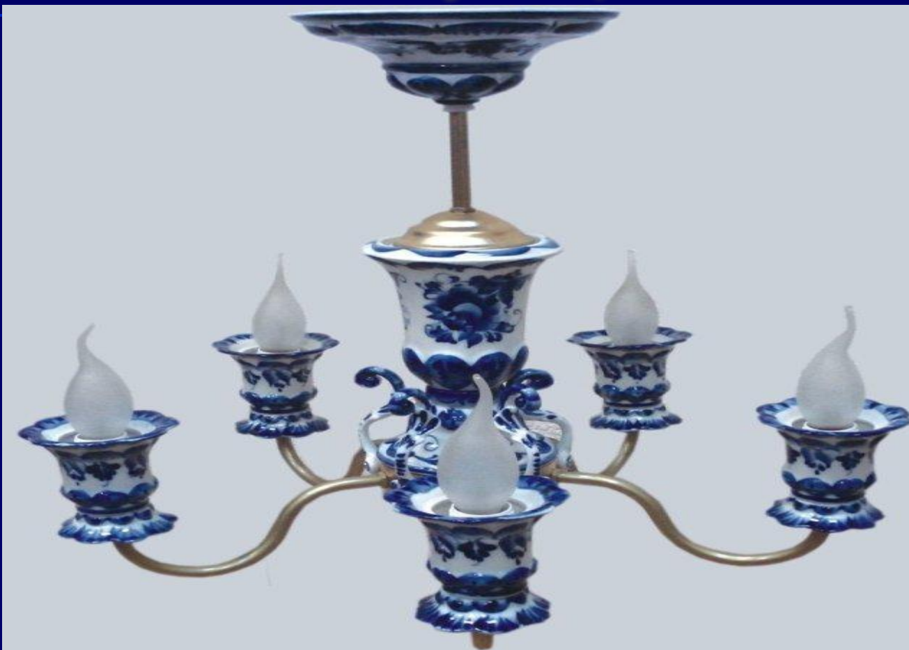
НСБ 12 - 5x60-102 Гжель