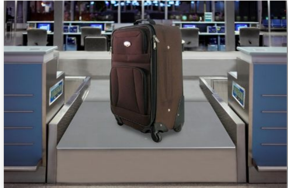
Весы в аэропорту