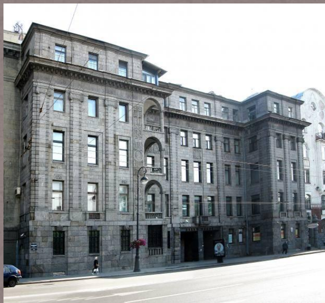
Доходный дом К. Маркова. (Неоклассицизм) Архитектор: Щуко Владимир Алексеевич .

Неоклассицизм, неоклассика, термин, принятый в советском искусствознании и отчасти литературоведении для обозначения различных по социальной направленности и идеологическому содержанию художественных явлений последней трети 19 — 20 вв., которым присуще обращение к традициям искусства античности, искусства эпохи Возрождения или классицизма.