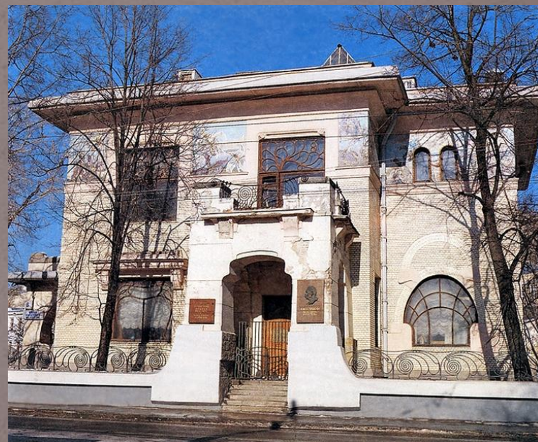
Особняк Рябушинского. Архитектор: Федор Шехтель.