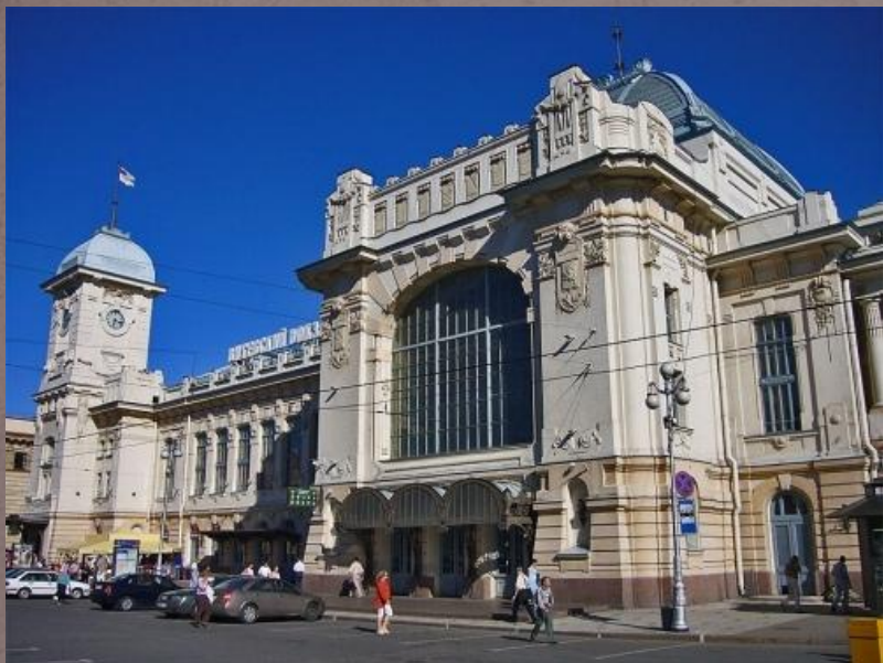
Витебский вокзал в Петербурге. Одно из первых общественных зданий в стиле модерн.

(Архитекторы: С. Бржозовский и С. Минаша)