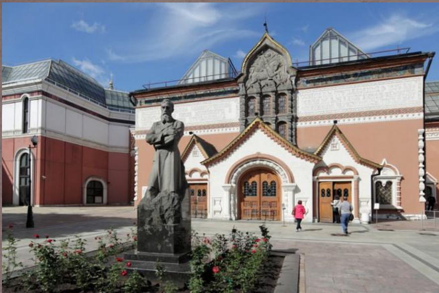
Третьяковская галерея. Архитектор: Александр Каминский