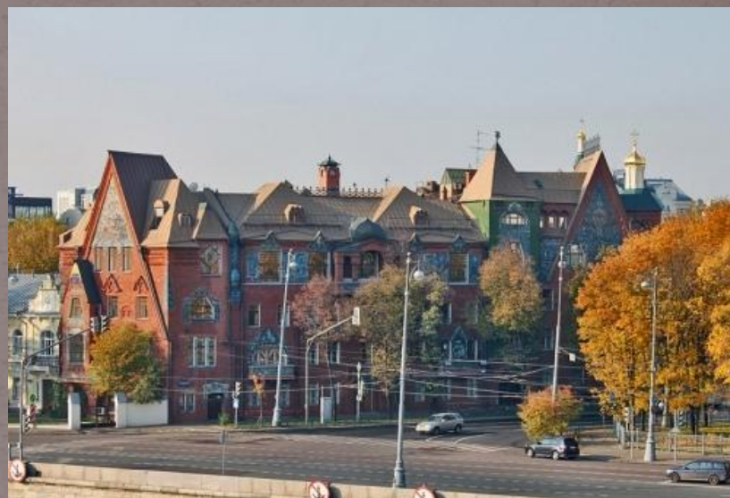
Доходный дом Перцова в Москве. (Архитекторы: С. Малютин и Н. Жуков)

(Архитекторы: С. Бржозовский и С. Минаша)