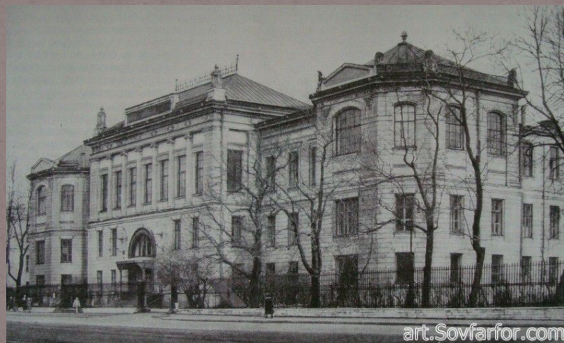
Императорский клинический повивальный институт Архитектор: Бенуа Леонтий Николаевич.

Модерн- художественное направление в искусстве, наиболее популярное во второй половине XIX — начале XX века. Его отличительными особенностями является отказ от прямых линий и углов в пользу более естественных, «природных» линий, интерес к новым технологиям в архитектуре, расцвет прикладного искусства.