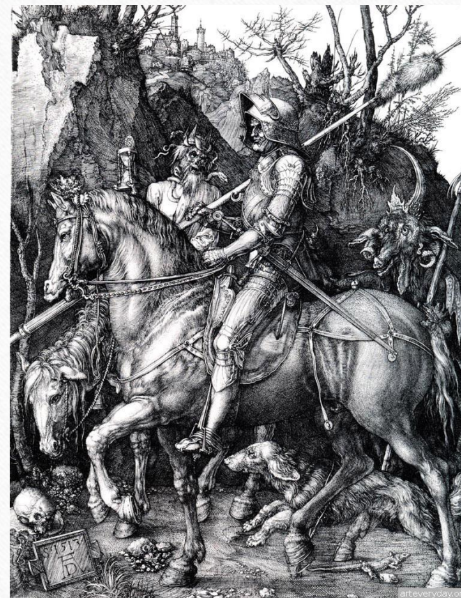
А.Дюрер. Рыцарь, смерть и дьявол. 1513-14 гг.