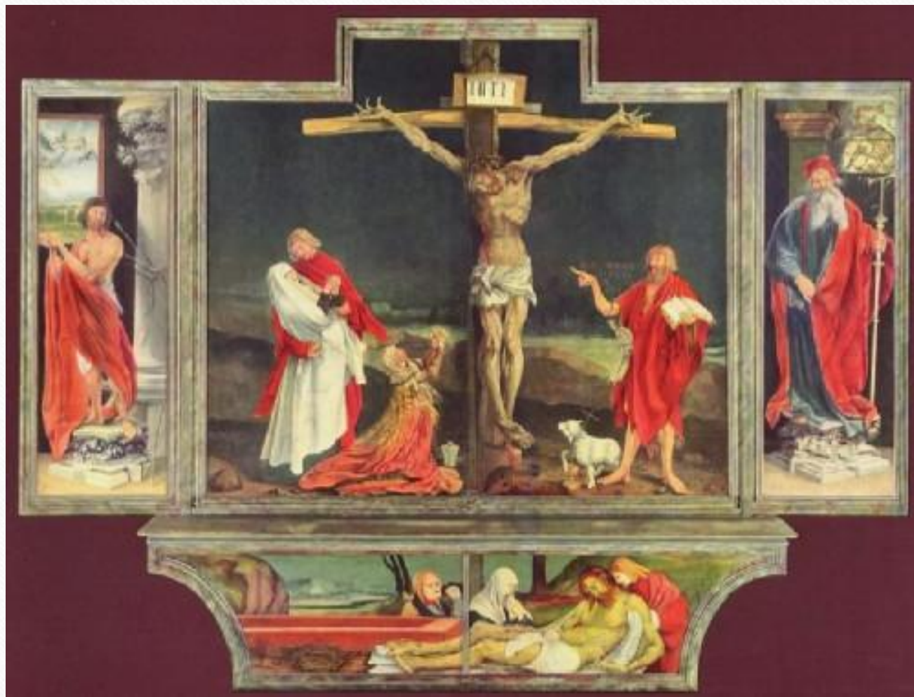
Распятие из Изенгеймского алтаря. 1512-1515 гг.