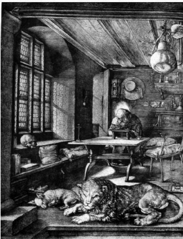
А. Дюрер. Св. Иероним в келье. 1514 г.