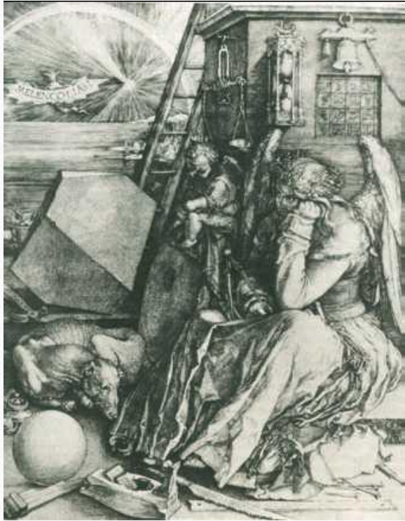
А. Дюрер. Меланхолия. 1514 г.