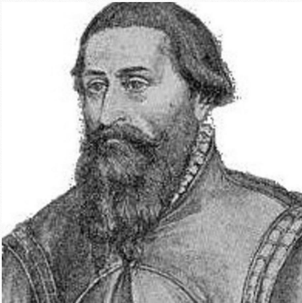
Фейт Штосс (1447 – 1553 г) - немецкий скульптор