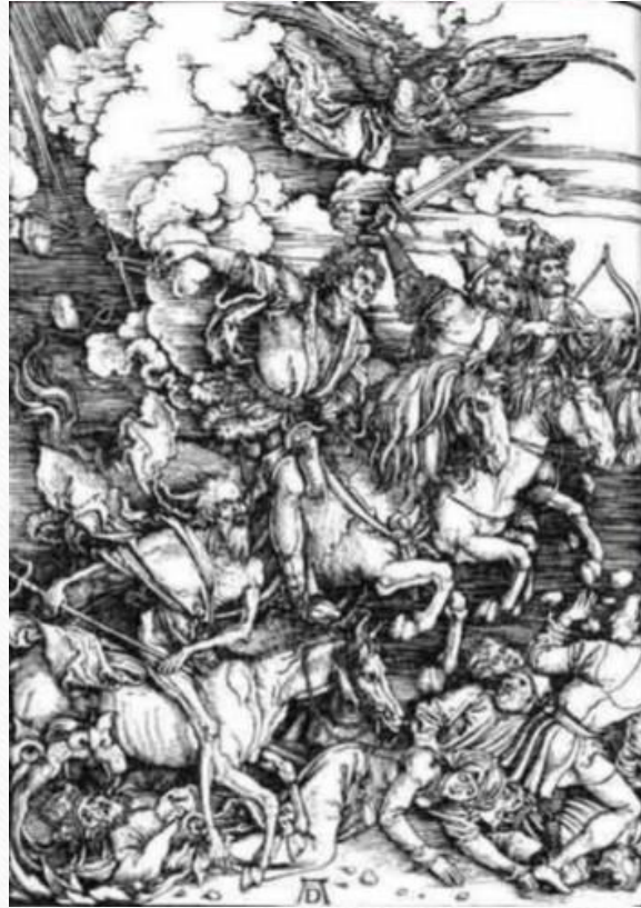
А. Дюрер. Четыре всадника Апокалипсиса. 1498 г.