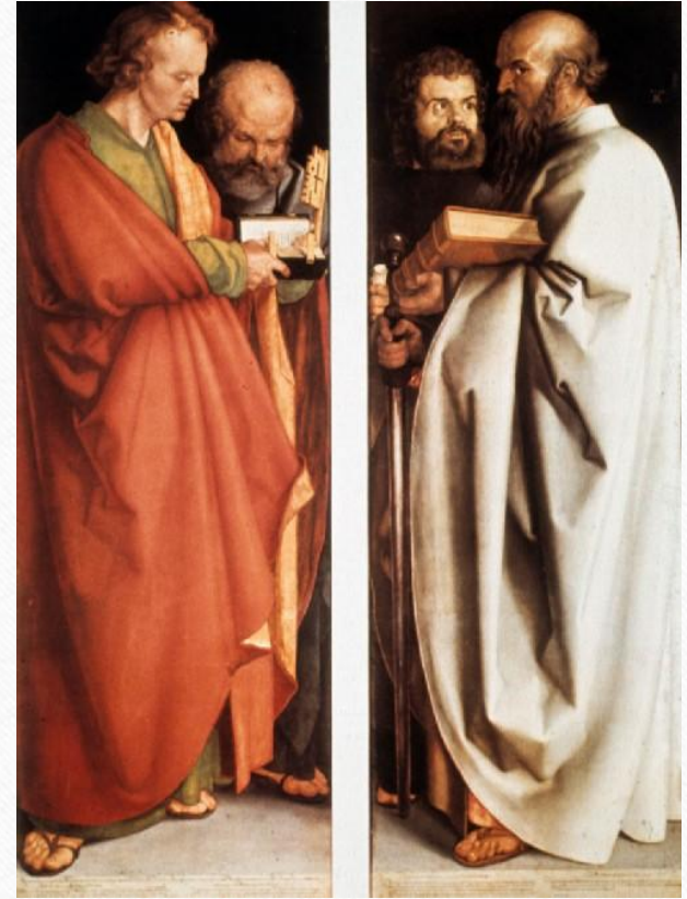
А. Дюрер. Четыре апостола. 1526 г.