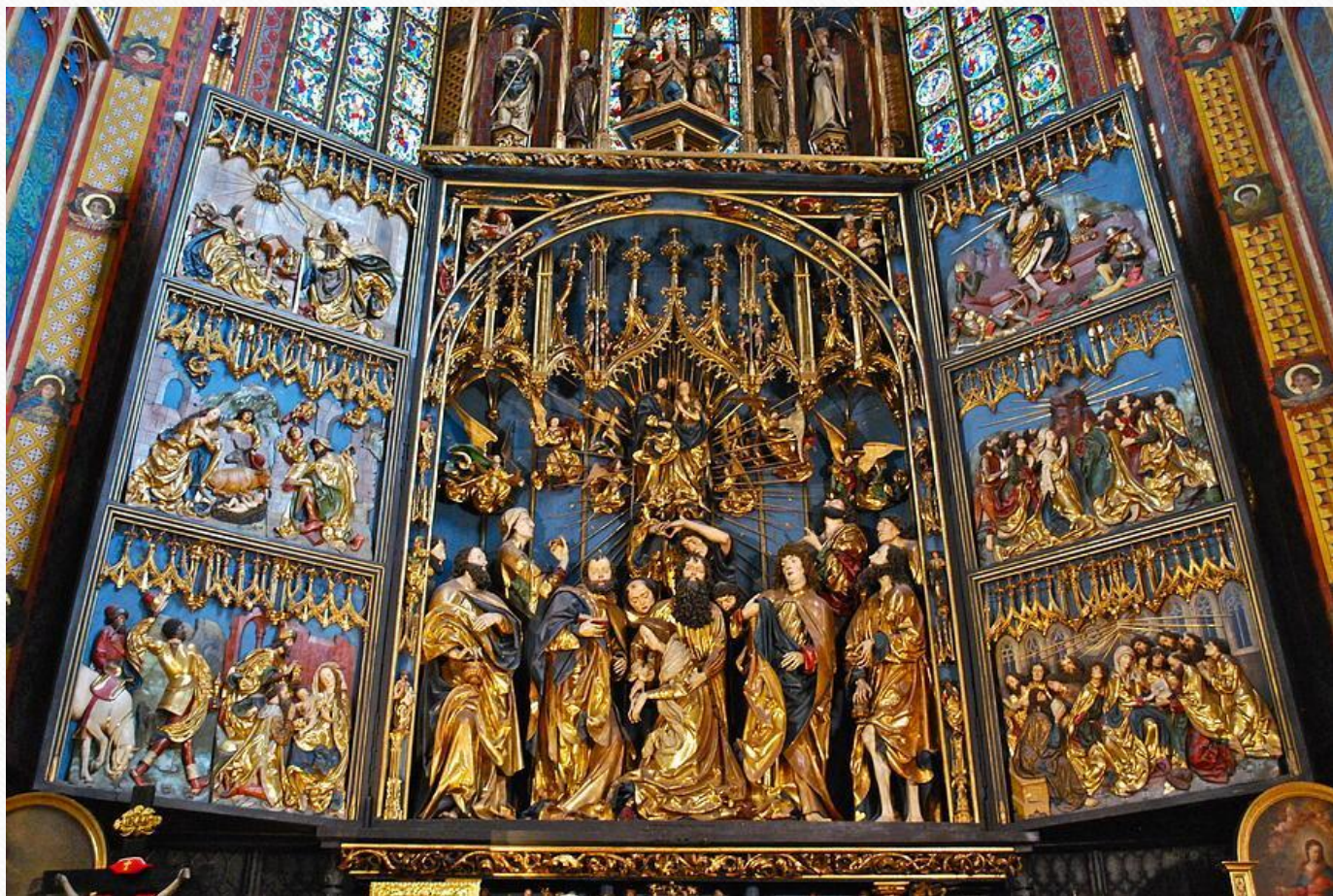
Резной раскрашенный деревянный алтарь в церкви Марии в Кракове