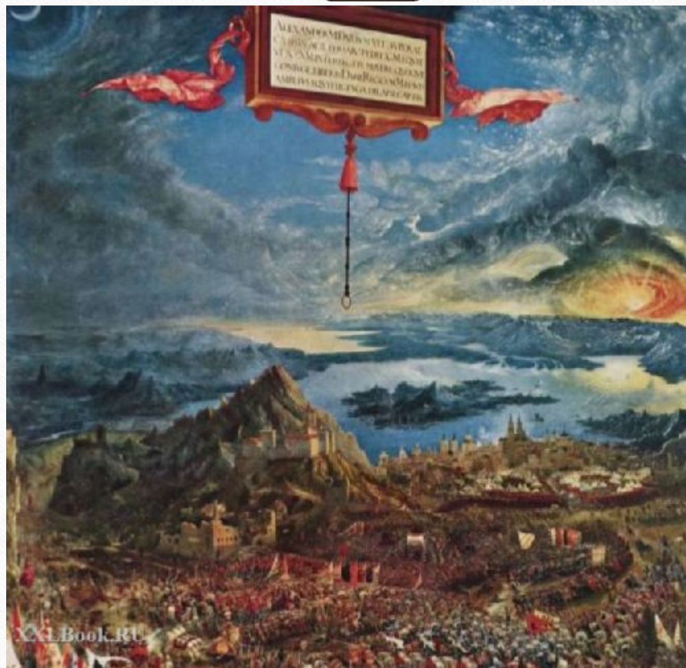
А. Альтдорфер. Битва Александра Македонского с Дарием. 1529 г.