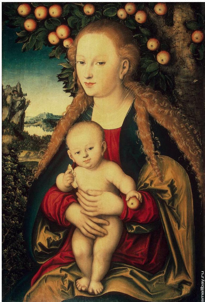
«Мария с младенцем»