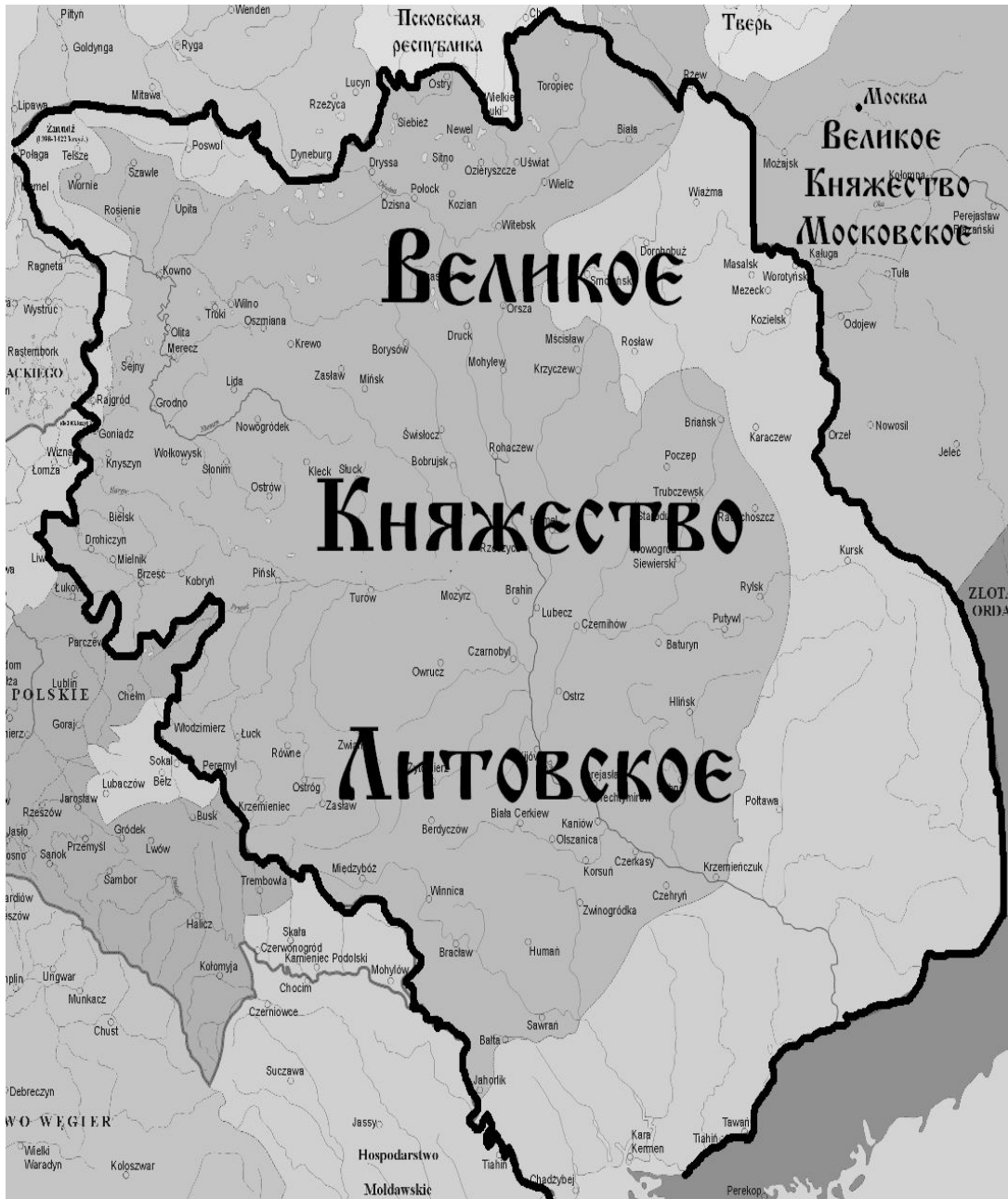
Территория Великого Княжества Литовского в период своего расцвета (XIV - XV века)