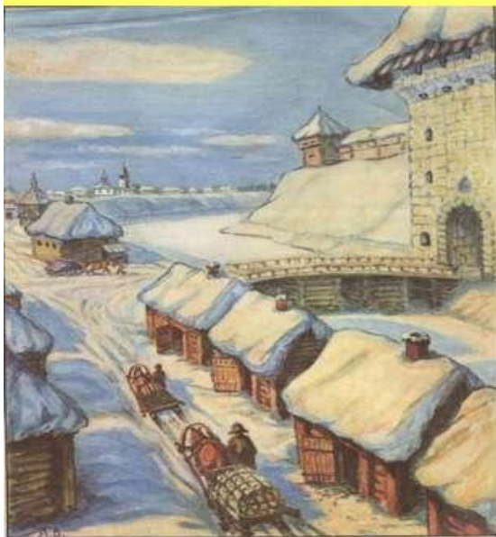
Владимирские ворота древней Твери.

Освобождение из-под власти Орды позволило Ивану III приступить к ликвидации Тверского княжества. Тверь уже была со всех сторон окружена московскими владениями. В 1483 г. овдовевший тверской князь Михаил Борисович попытался заключить союз с Литвой, скрепив его женитьбой на внучке Казимира IV. Казимир IV обязался защищать Тверь. Но Иван III не допустил этого. Его войска «попленили» тверские земли. Михаилу пришлось капитулировать. Он теперь не мог заключать договоры с другими государствами.