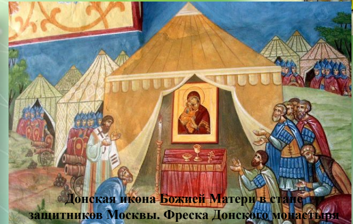
Донская икона Божией Матери в стане защитников Москвы. Фреска Донского монастыря