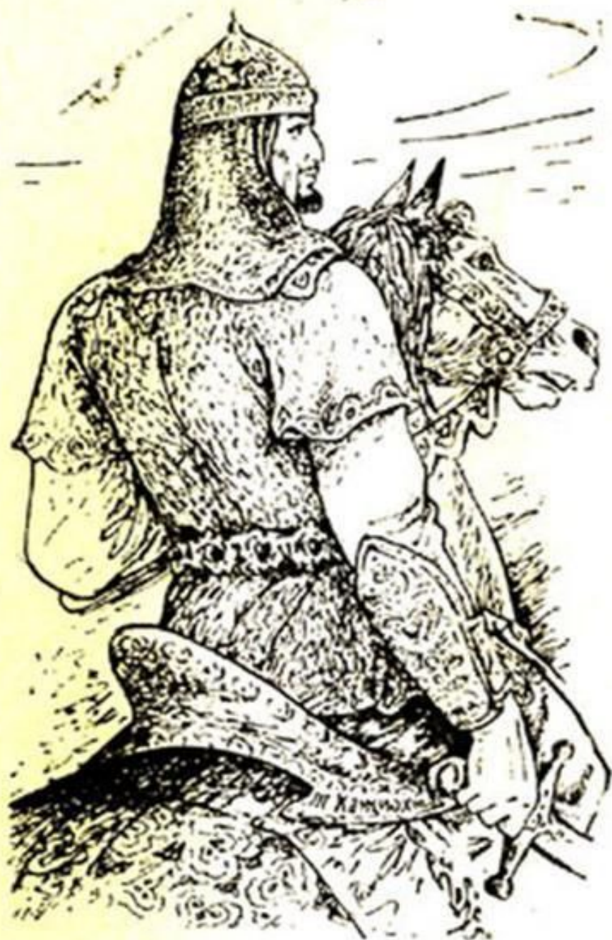
Едыгей – основатель Ногайской Орды