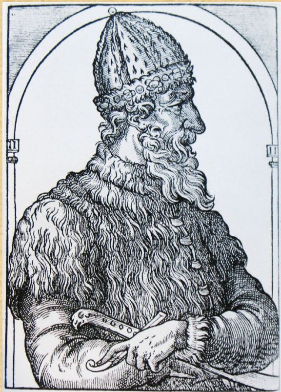
Иван III. Гравюра XVI в.

- великий князь московский (с 1462 г.), государь всея Руси. При Иване III Русское государство окончательно преодолело зависимость от ордынских ханов, Москва стала центром единого Российского государства.