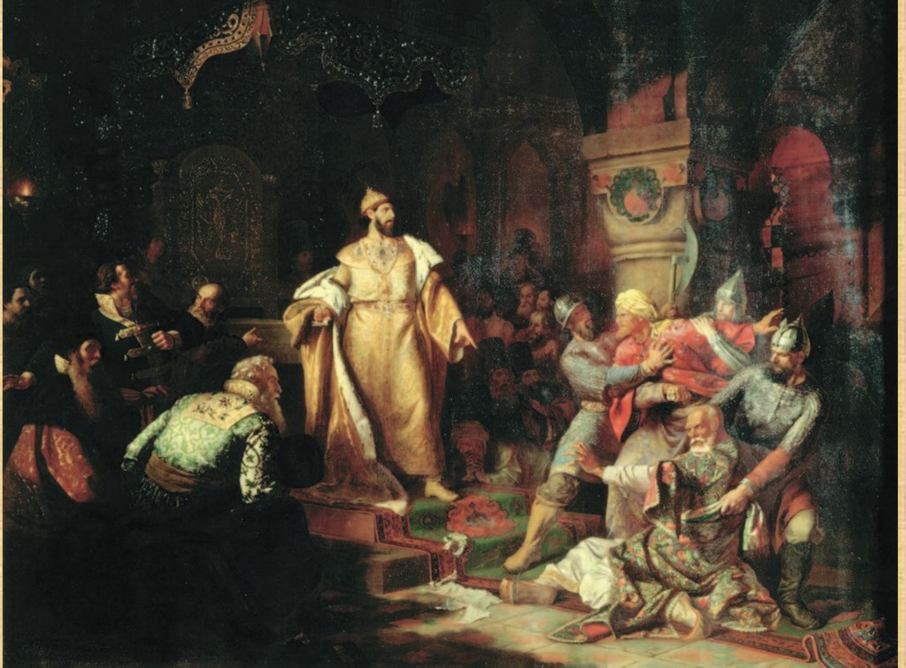
Иоанн III разрывает ханскую грамоту. Худ. Н.С. Шустов. 1862г.