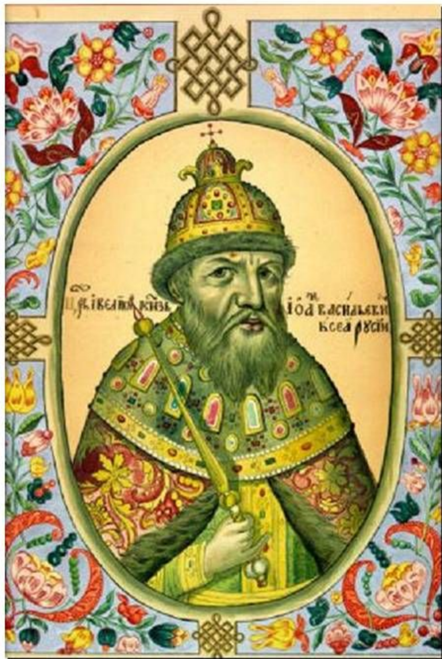
Миниатюра из царского «Титулярника», 1672 год.