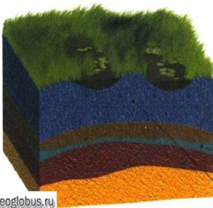
Верховое болото на водоразделе