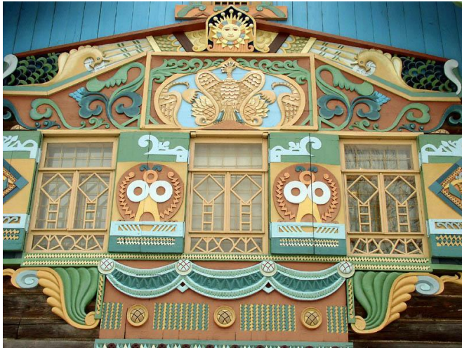
Малютин. Теремок в Талашкино.

Художественный центр Талашкино – известный историко-художественный заповедник на Смоленщине, также тесно связан с развитием русского искусства конца XIX – начала XX веков.