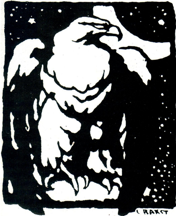
Бакст. Марка журнала «Мир Искусства».

90-е гг. прошлого века ознаменованы возникновением “Мира искусства” из небольшого кружка друзей, связанных совместным обучением в гимназии Мая, университетом, знакомством, родством. В 1889 г. несколько молодых людей во главе с Александром Бенуа создали кружок самообразования. Издание своего журнала, к которому члены кружка приступили в 1898 г., становится логическим продолжением их пропагандистской и культурной деятельности. Соиздателями журнала стали владельцы Абрамцева и Талашкина – Савва Мамонтов и Мария Тенишева. Издавая свой журнал, члены объединения стремились придерживаться основополагающей для модерна моррисовской концепции книги: книга – произведение искусства, единый организм, в котором все компоненты равноценны.