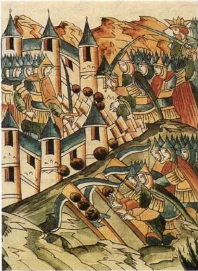
Осада монголами Козельска

В конце марта монголы подошли к небольшой крепости Козельск . Горожане оказывали мужественное сопротивление захватчикам в течение почти двух месяцев. Батый назвал Козельск «злым городом» и приказал сровнять его с землёй.