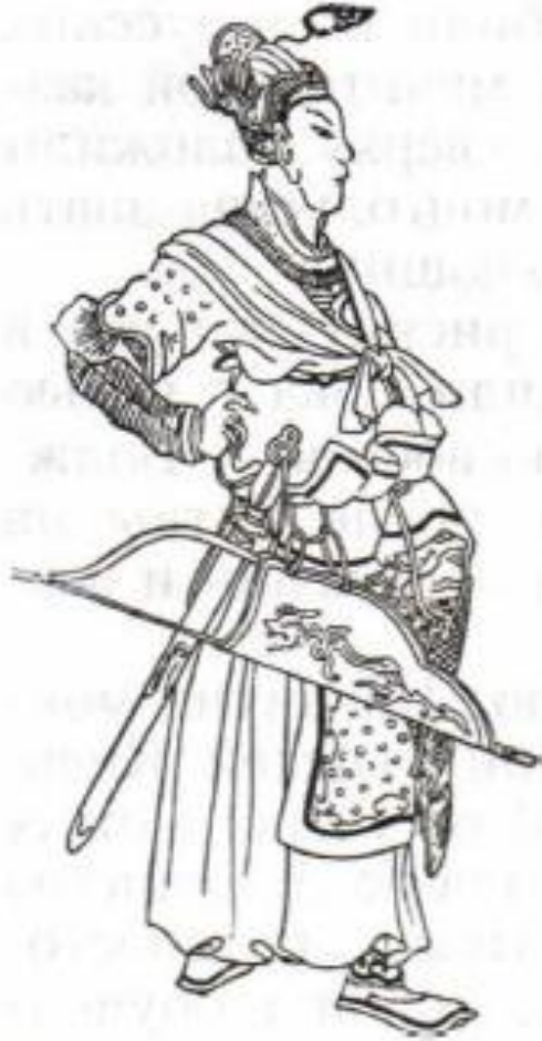
Батый. Рисунок из восточной рукописи

Первый удар был нанесён в конце 1237 года по Рязанскому княжеству. Рязанский князь обратился за помощью к великому князю владимирскому Юрию Всеволодовичу , но тот направил лишь небольшую дружину во главе со своим младшим сыном Всеволодом на защиту важной крепости Коломны .