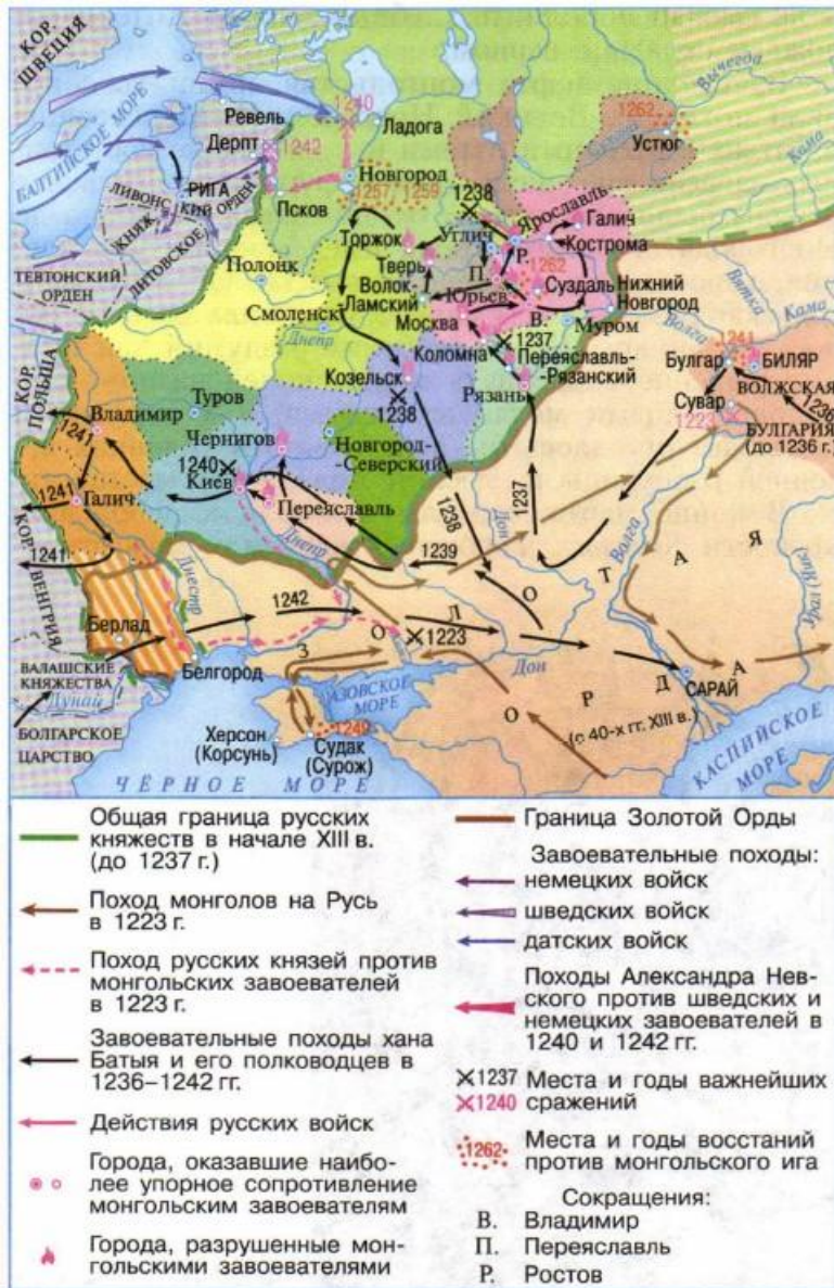
Русь в середине XIII века

После победы на реке Сити монгольские войска устремились к Новгороду . Их путь лежал через Торжок . Этот город был перевалочным пунктом для новгородских купцов и торговцев из Владимира и Рязани, снабжавших Новгород хлебом. В Торжке всегда имелись запасы зерна. Здесь монголы рассчитывали пополнить оскудевший за зиму запас кормов.