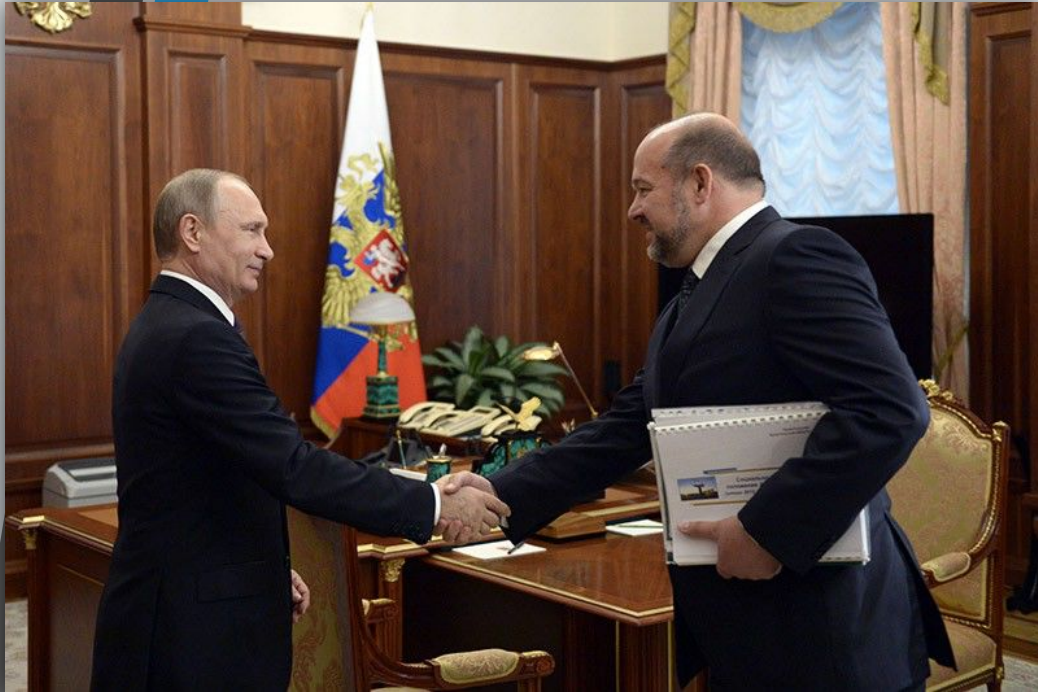
Владимир Путин и Игорь Орлов

смог совладать с оппозиционностью местных элит и выровнял экономику Архангельской области;