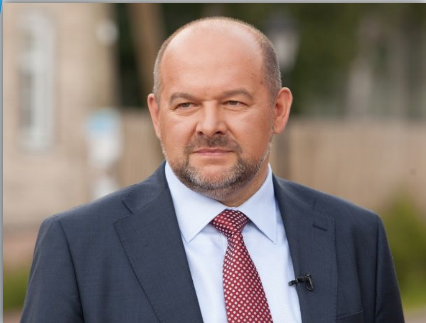
Игорь Анатольевич Орлов – губернатор Архангельской области с 3 февраля 2012 года

Архангельское областное Собрание депутатов