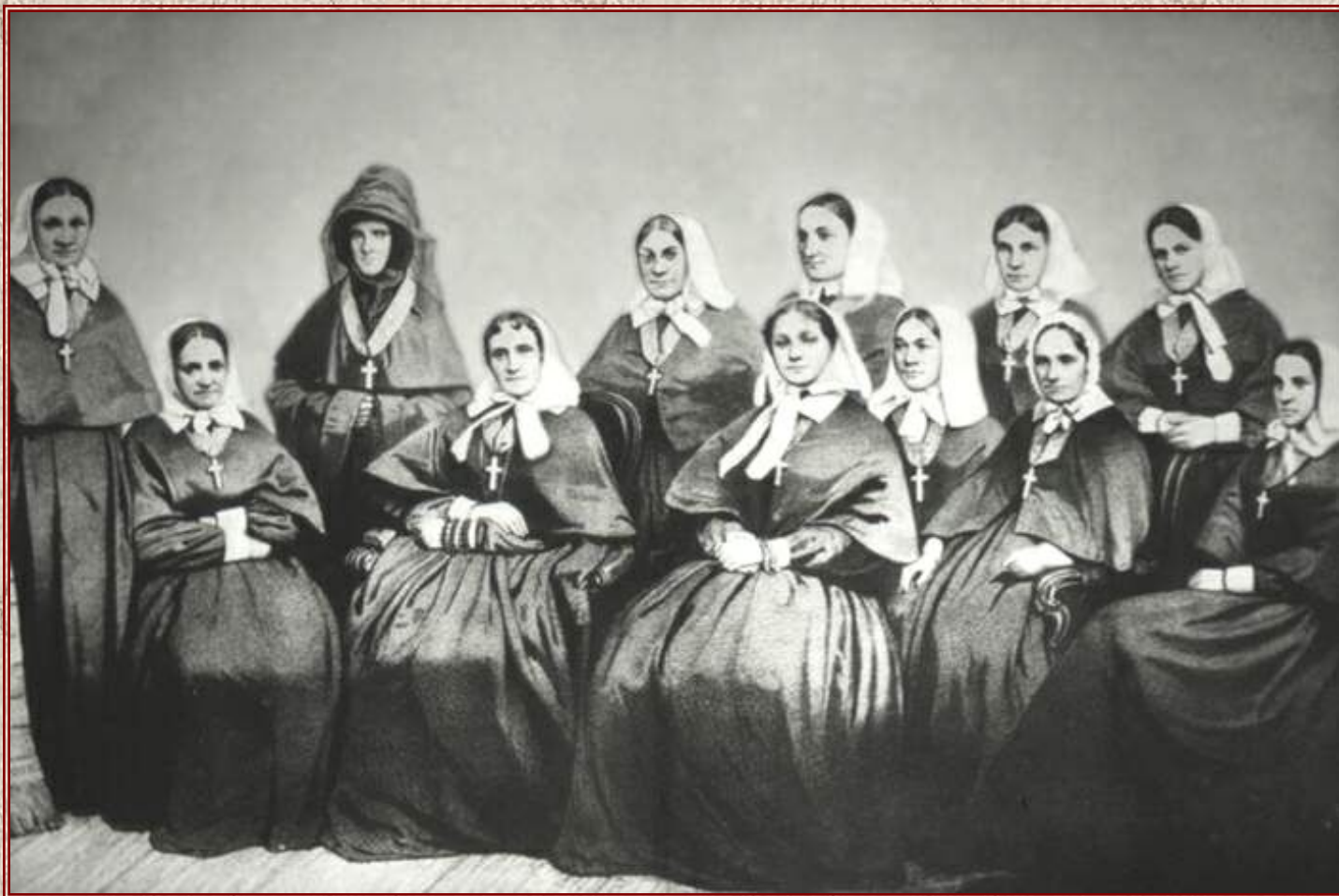
Даша Севастопольская - сестра милосердия, героиня обороны Севастополя в Крымскую войну