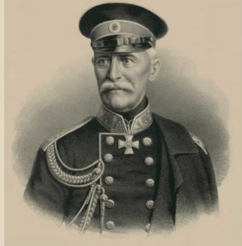
Светлейший князь Александр Сергеевич Меншиков (1787-1869)

В 1853-1855 годах главнокомандующий сухопутными и морскими силами в Крыму