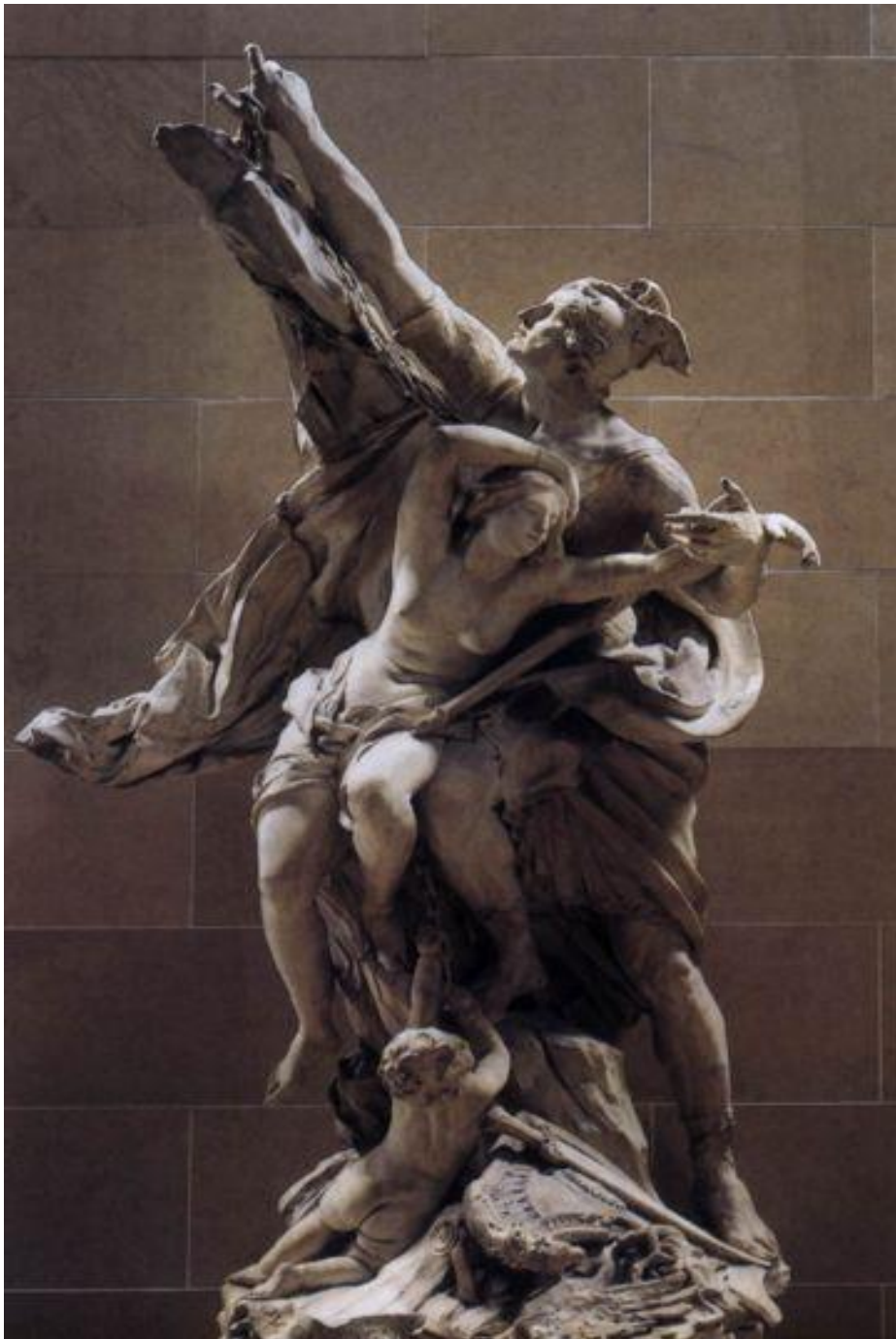
Персей і Андромеда . 1678—84