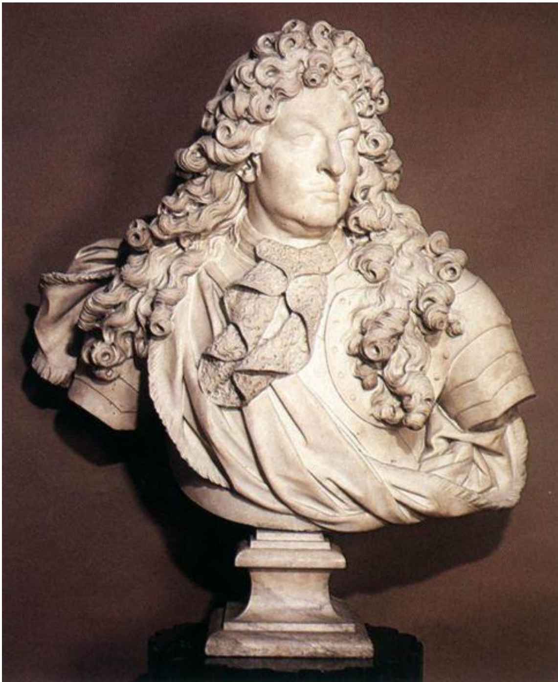
Бюст Людовіка XIV . 1686