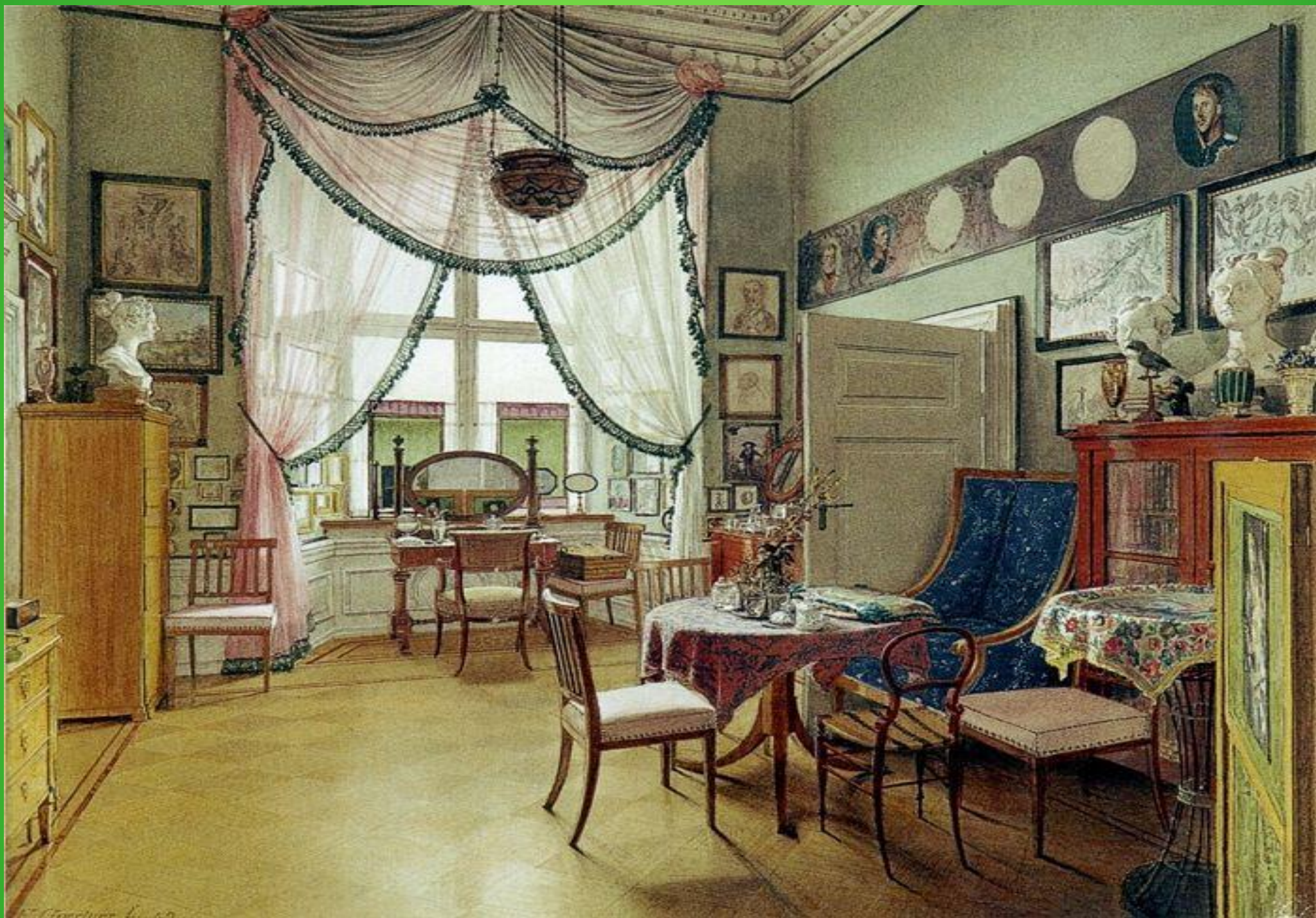
Эдуард Гертнер, изображение комнаты, 1849