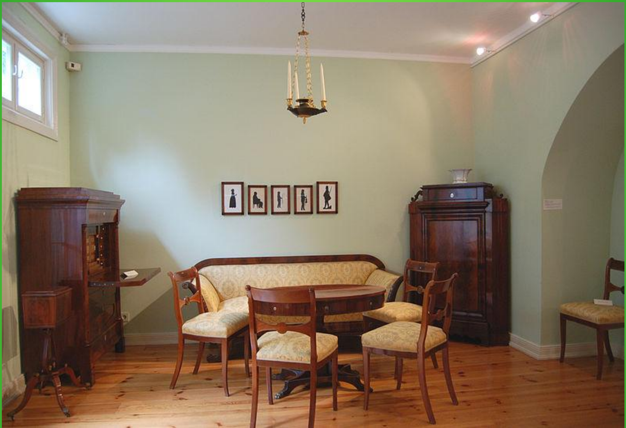
Музей Лангес Таннен, г. Утерсен (Германия), типичная обстановка комнаты Бидермайера