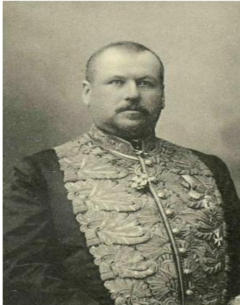
М. В. Родзянко