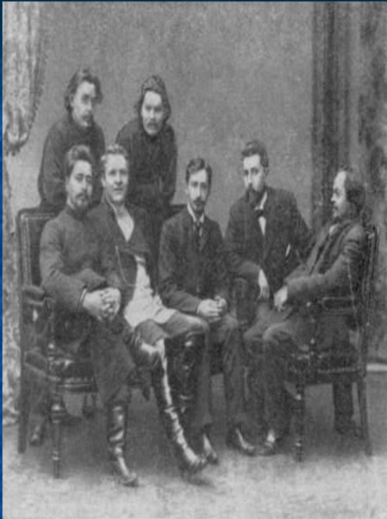
«Среда». Сидят — Л. Н. Андреев, Ф. И. Шаляпин, И. А. Бунин, Н. Д. Телешов, Е. Н. Чириков; стоят — С. Г. Скиталец, М. Горький. Фотография.

Общественная позиция Горького была радикальной. Он не раз подвергался арестам, в 1902 Николай II распорядился аннулировать его избрание почетным академиком по разряду изящной словесности (в знак протеста Чехов и Короленко вышли из Академии). В 1905 вступил в ряды РСДРП (большевистское крыло) и познакомился с В.И.Лениным . Им оказывалась серьезная финансовая поддержка революции 1905-07.