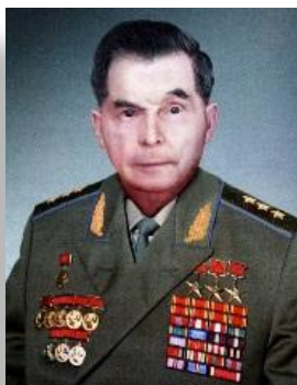
Ильюшин Сергей Владимирович