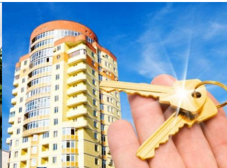
Программа ипотечного кредитования