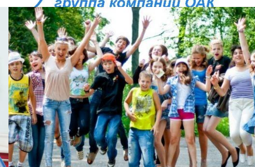
Детский лагерь «Дружба»