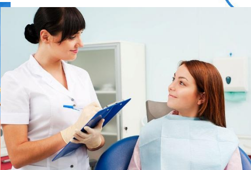
Программа добровольного медицинского страхования