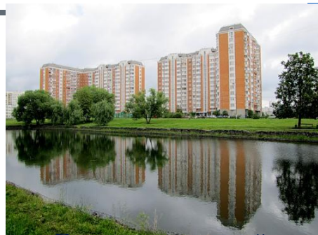
Программа частичной денежной компенсации найма жилья