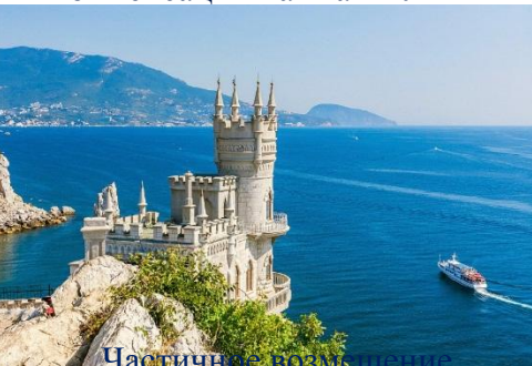
Частичное возмещение за санаторно-курортное лечение в санаториях и пансионатах 50%