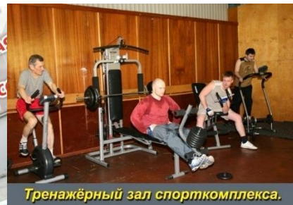
Тренажерный зал спорткомплекса.