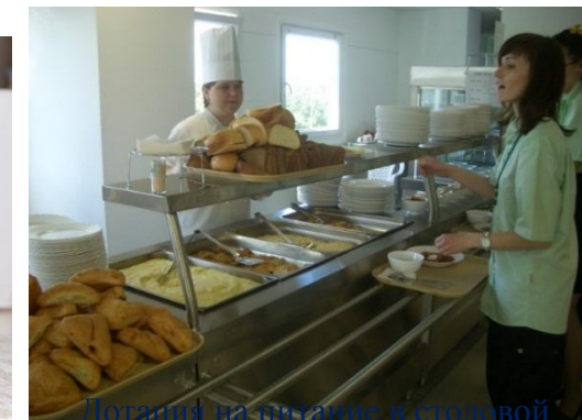
Досуг на питание в столовой Предприятия.