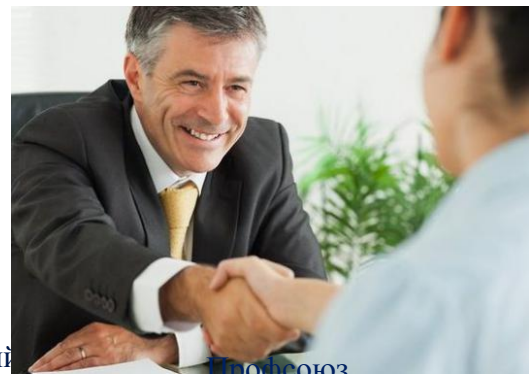
Профсоюз Совет молодых специалистов