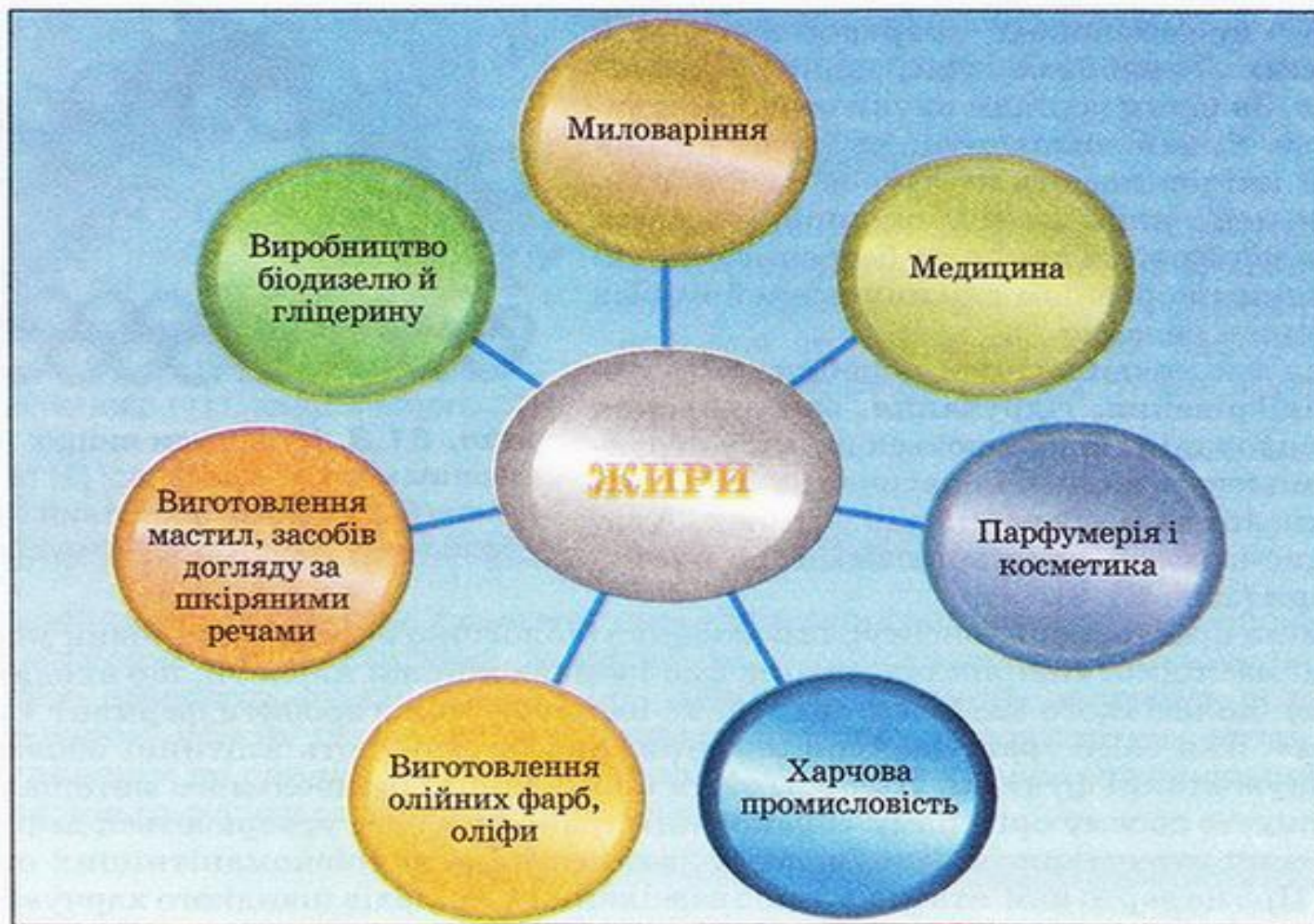
Мал. 31.5. Застосування жирів. Близько третини вироблених жирів використовують як технічні, решту – у харчуванні