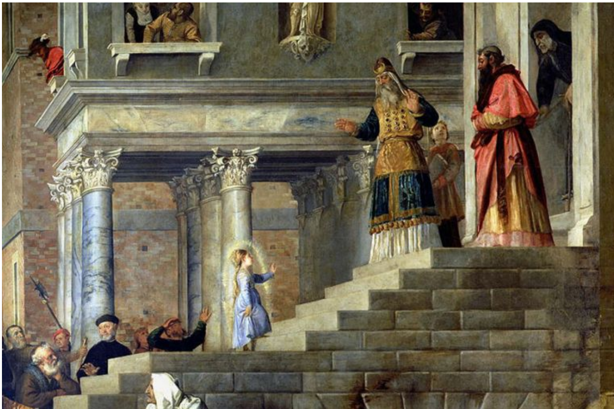
«Введение во храм» (1534—1538 гг.)