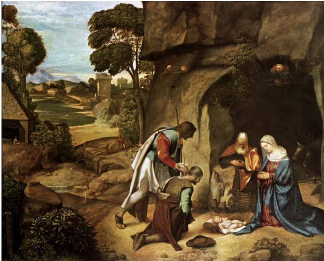
«Поклонение пастухов» 1505 г.