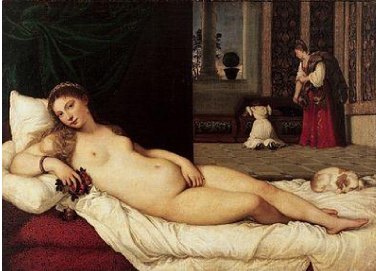
Венера Урбинская. 1538 г.