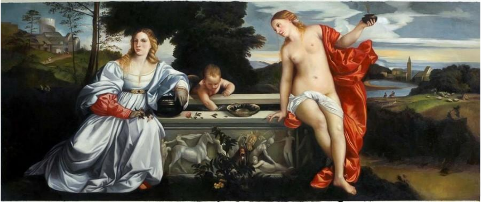
«Любовь небесная и земная» (1515—1516 гг.)