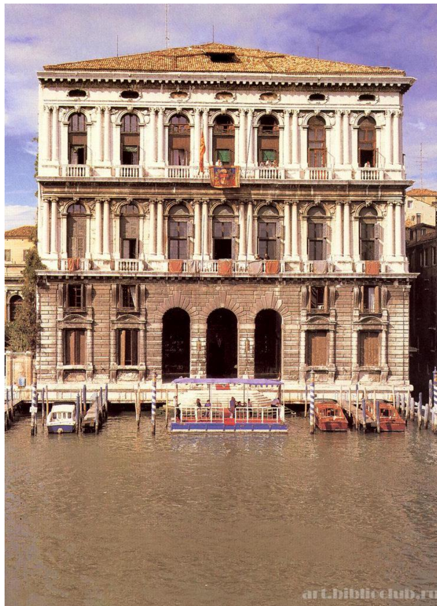
Корнер делла Ка-Гранде, 1532—1537