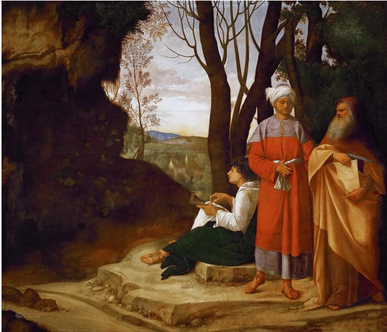
«Три философа» 1505-1509