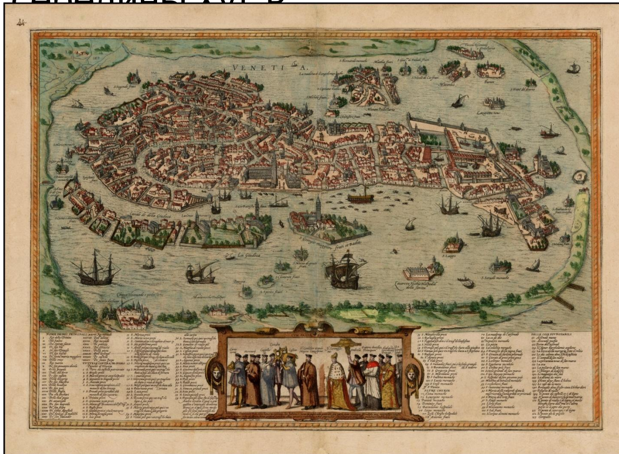
Карта Венеции работы Болоньино Зальтиери, 1565 год