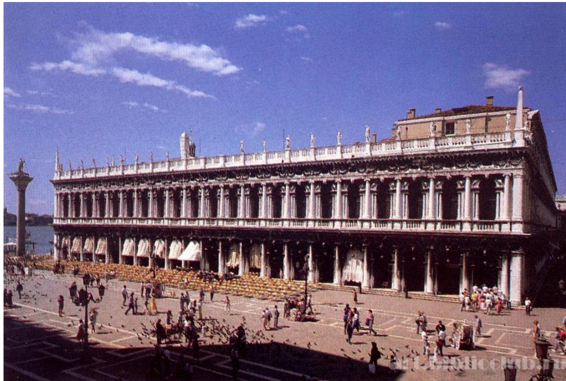
Библиотека Сан- Марко