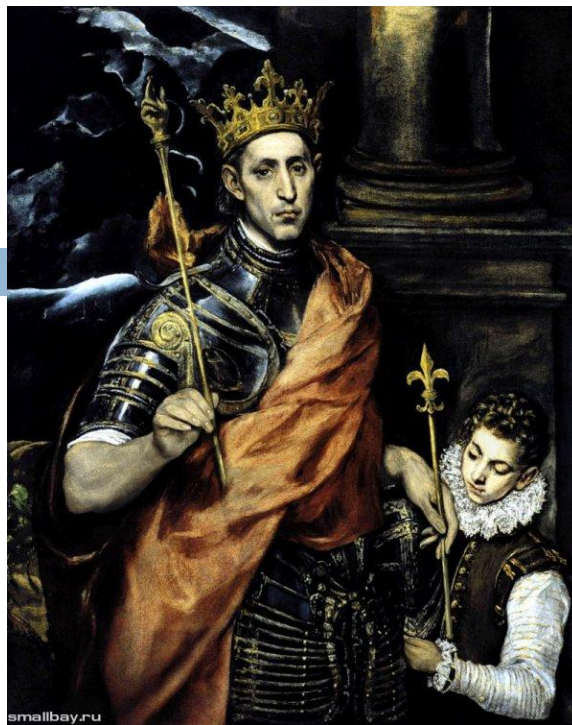
Святой Людовик король Франции