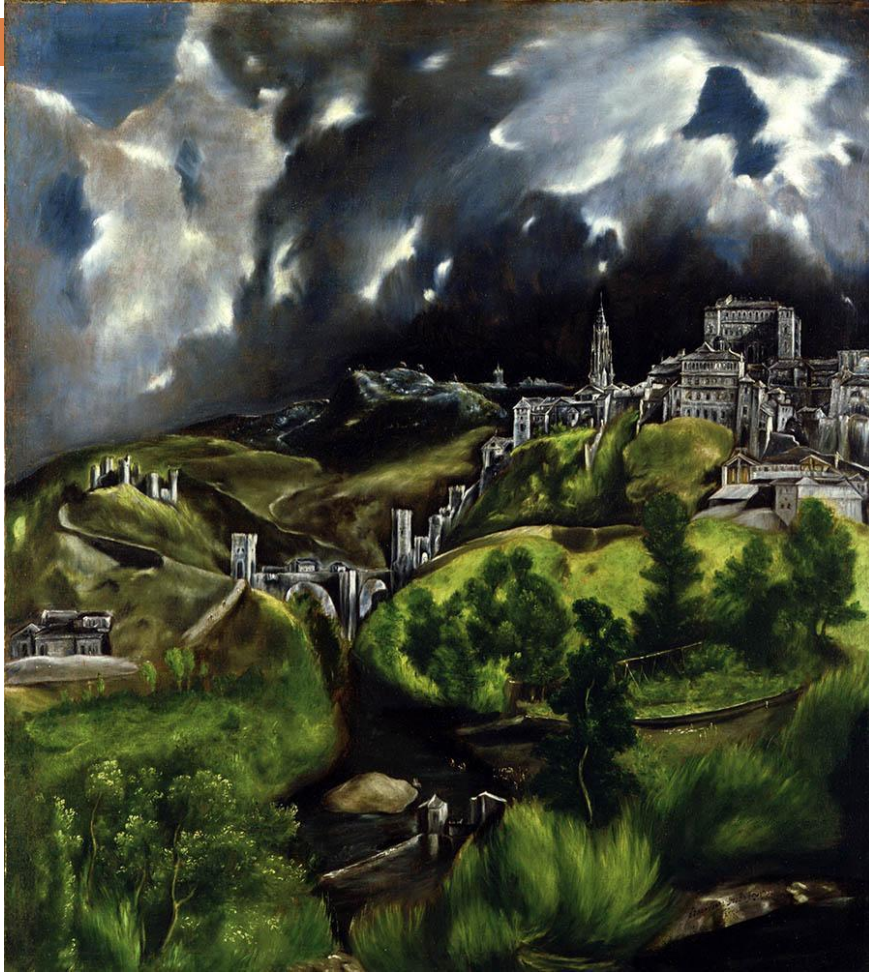
Вид Толедо. 1604—1614.