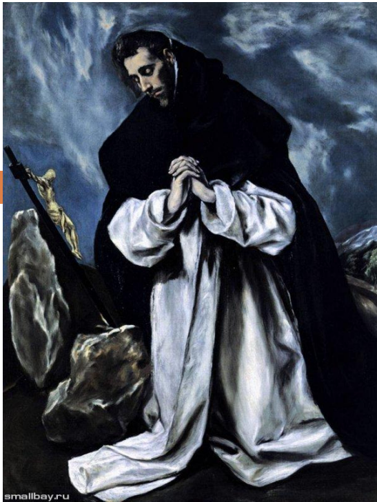
Молитва святого Доминика