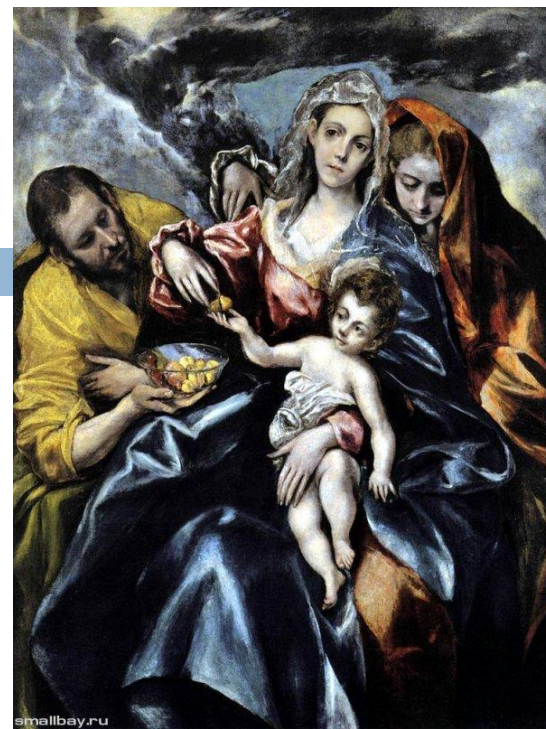
Святое семейство с Марией Магдалиной

Повышенная одухотворенность образов сближает искусство Эль Греко с маньеризмом и выражают кризисное состояние художественной культуры Позднего Возрождения. Отмеченное напряженным стремлением к выражению возвышенно-драматических порывов человеческого духа, творчество Эль Греко в XVII-XIX веках было забыто и заново открыто только в начале XX века.