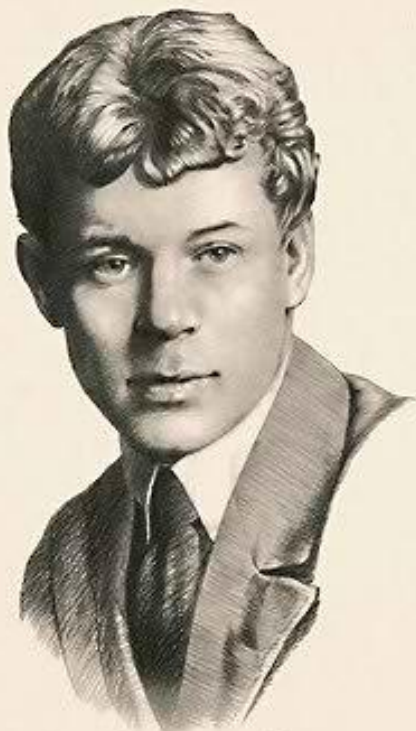
Сергей Александрович Есенин 1895—1925