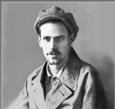
Юрий Васильевич Кондратюк

Юрий Васильевич Кондратюк – предложил при полетах к другим планетам выводить корабль на орбиту его искусственного спутника. Для посадки человека на другую планету и возвращения на корабль применить небольшой взлетно-посадочный корабль.