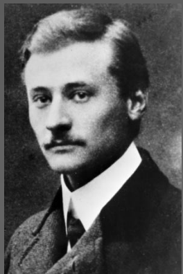
Фридрих Артурович Цандер

Идеи Циолковского были развиты Фридрихом Артуровичем Цандером – советский ученый и изобретатель в области теории межпланетных полетов, реактивных двигателей. Идеи Циолковского были развиты Фридрихом Артуровичем Цандером – советский ученый и изобретатель в области теории межпланетных полетов, реактивных двигателей.