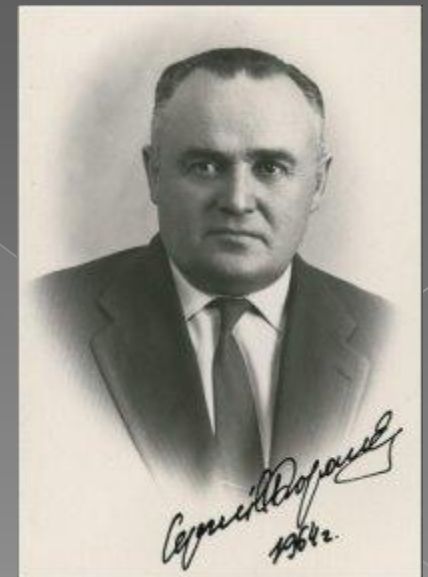
Сергей Павлович Королев