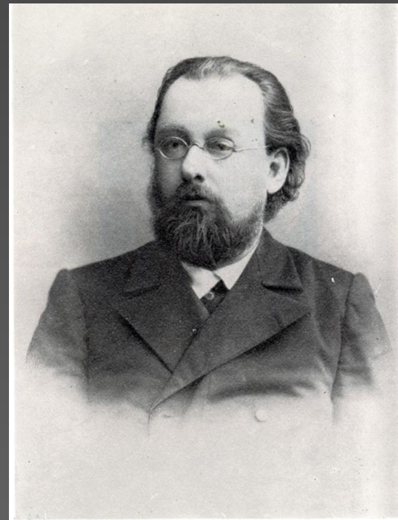
Константин Эдуардович Циолковский

Судьба и жизнь Циолковского необычны и интересны. Первая половина детства у Кости Циолковского была обычной, как у всех детей. Уже находясь в преклонном возрасте, Константин Эдуардович вспоминал, как ему нравилось лазить по деревьям, забираться на крыши домов, прыгать с большой высоты, чтобы испытать чувство свободного падения. Второе детство началось, когда заболев скарлатиной, почти полностью потерял слух. Глухота причиняла мальчику не только бытовые неудобства и моральные страдания. Она грозила замедлить его физическое и умственное развитие. Он мечтает о космических путешествиях. Запоем читает книги по физике, химии, астрономии, математике. Понимая, что его способного, но глухого сына не примут ни в одно учебное заведение, отец решает отправить шестнадцатилетнего Костю в Москву для самообразования. Костя в Москве снимает угол и с утра до вечера сидит в бесплатных библиотеках. Отец ежемесячно присылает ему 15–20 рублей, Костя же, питаясь черным хлебом и запивая его чаем, тратит в месяц на еду 90 копеек! На остальные деньги покупает реторты, книги, реактивы. Последующие годы также были нелегкими. Он много натерпелся от чиновничьего равнодушия к его трудам и проектам. Болел, падал духом, но вновь собирался, производил расчеты, писал книги. Теперь мы уже знаем, что Константин Эдуардович Циолковский – гордость России, один из отцов космонавтики, великий ученый. И с удивлением многие из нас узнают, что великий млечный путь к иным мирам и звездам.