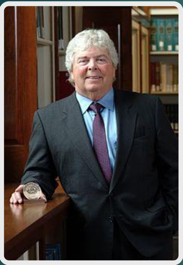
Герберт Бойер 10 июля 1936 г.