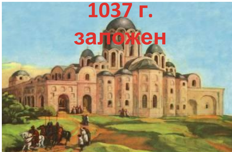
Тринадцатиглавый собор Святой Софии в

На Руси развивалось образование, культура, грамотность.