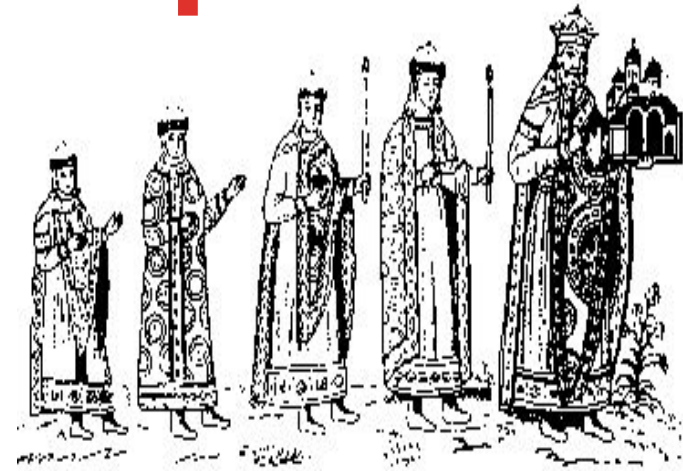
Изображение Ярослава Мудрого и его семьи (фреска Софийского собора в Киеве).

Сын Всеволод женился на дочери Византийского короля Константина Анастасии.