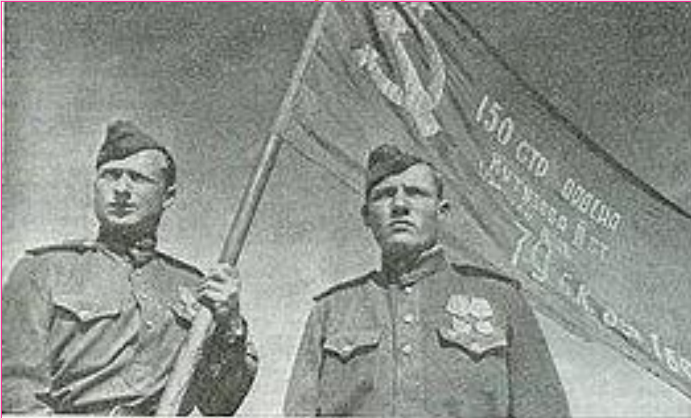
Алмалычки 756-го полка 150-й стрелковой дивизии М. А. Егоров (слева) и И. В. Кантария со Знаменем Победы, Берлин, Май 1945.