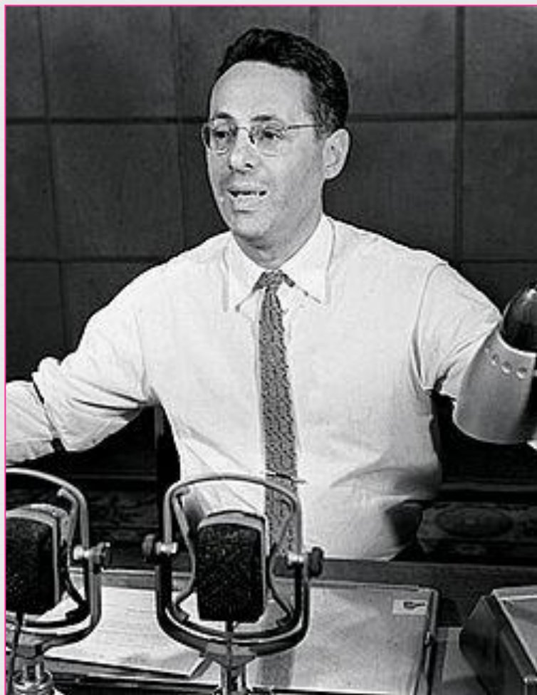
Юрий Борисович Левитан.