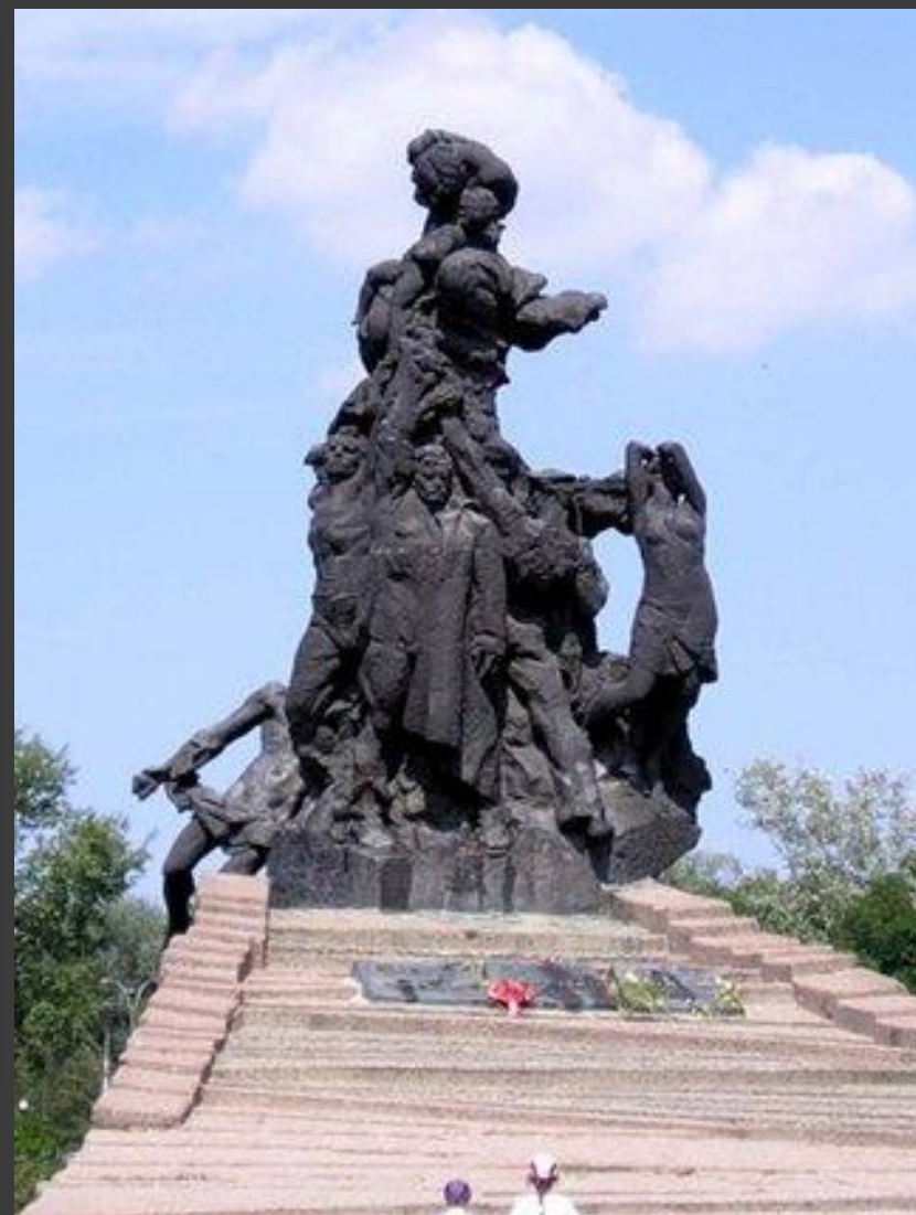
Мемориалы в Бабьем Яру.