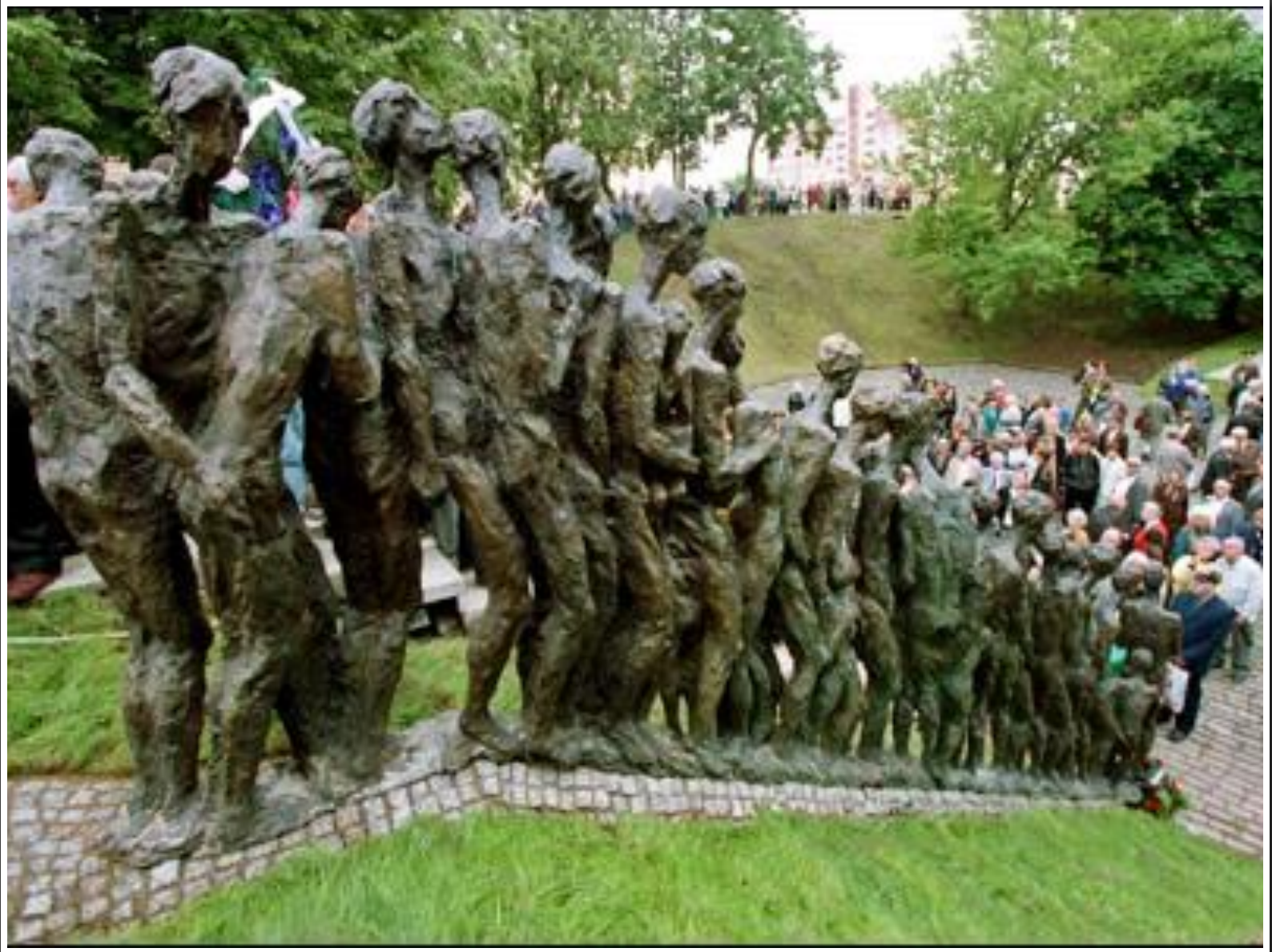
Памятник жертвам холокоста в Минске