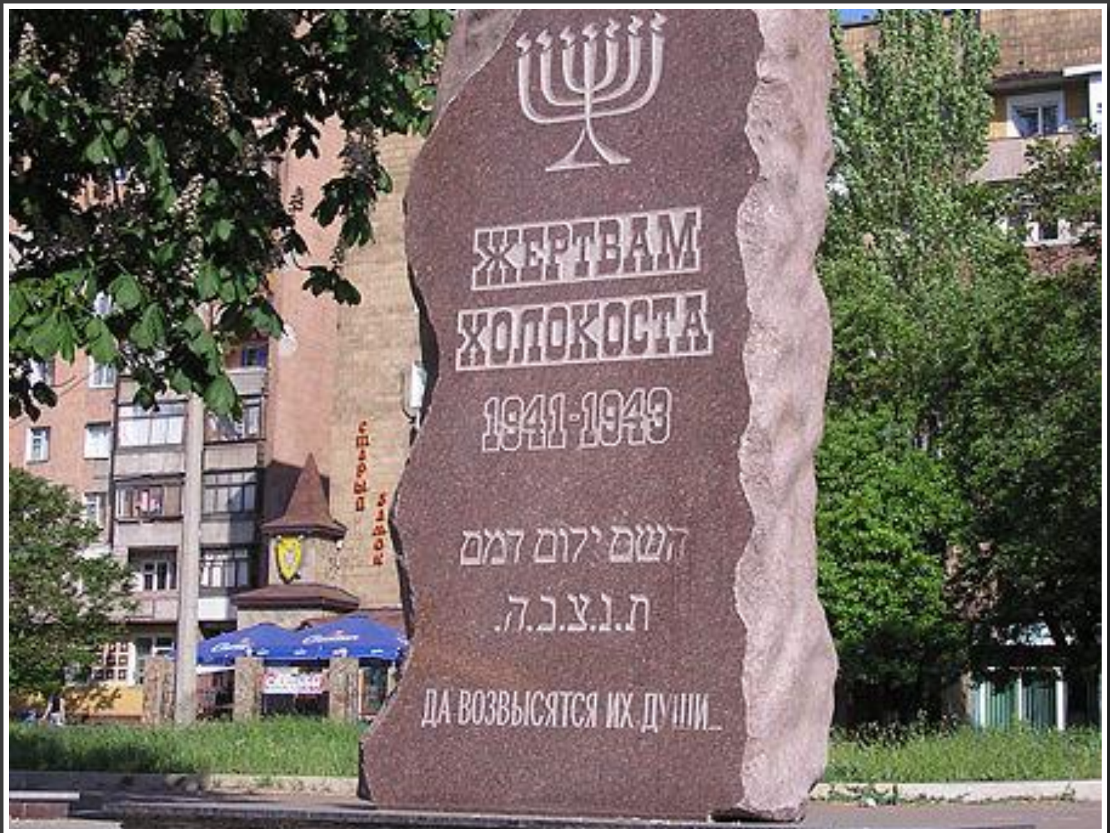
Памятник жертвам холокоста в Донецке