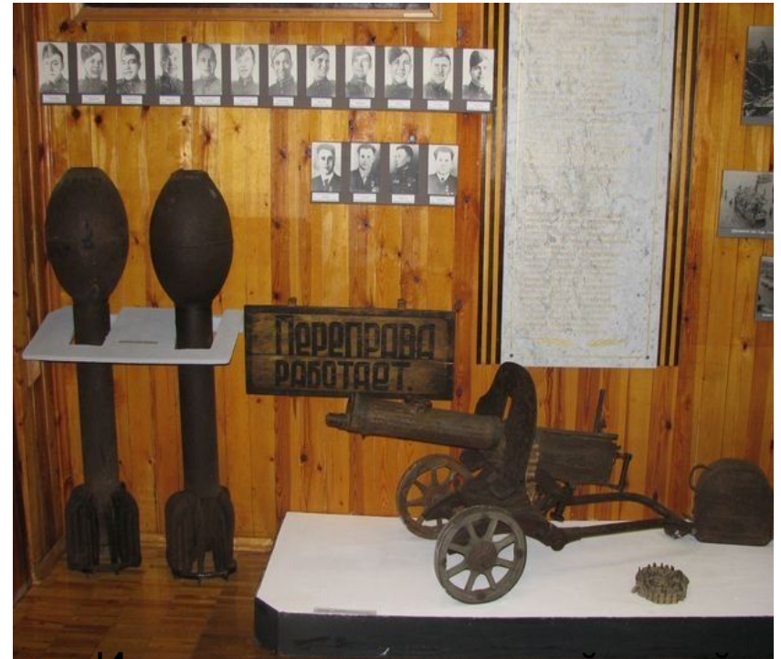
Историко-краеведческий музей г. Лодейное поле