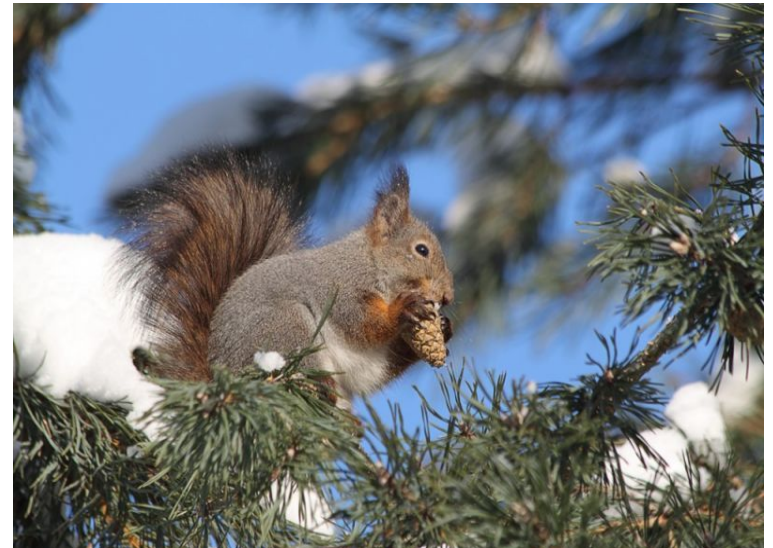
Нижне-Свирский орнитологический заповедник