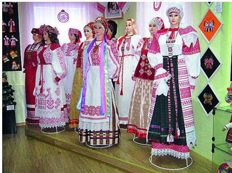
Народная студия декоративно-прикладного искусства «Домовушка»

Лодейнопольский район- край удивительной северной природы, расположенный на северо-востоке Ленинградской области на границе с Карелией. Здесь можно соединить для себя общение с природой и ознакомление с богатыми культурными и историческими традициями этого края.