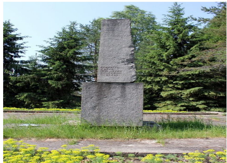
Мемориал парк «Свирская победа»