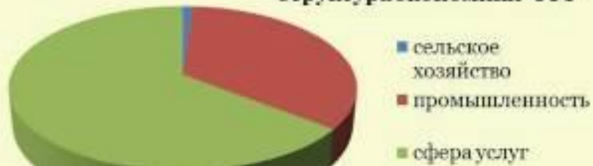
Структура экономики ФРГ

Для экономики Германии характерна "сверхиндустриализация"